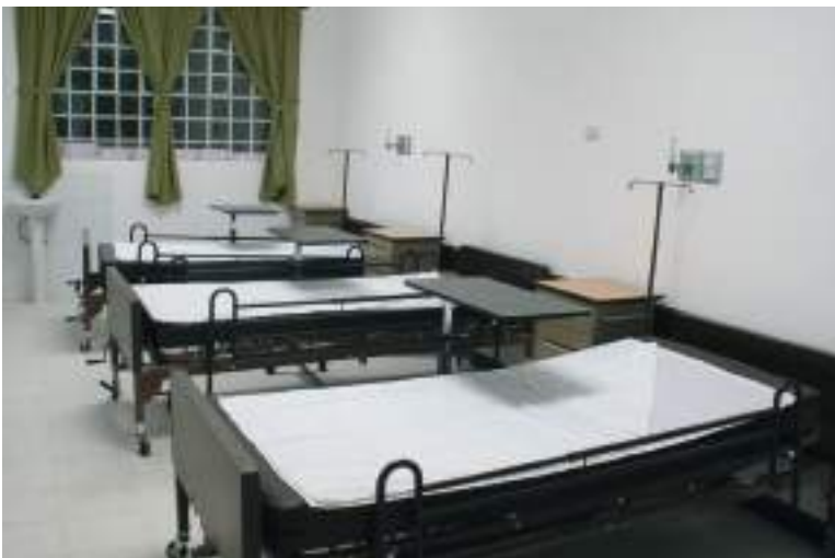
El área de encamamiento donde se atiende a los pacientes que requieren hospitalización.