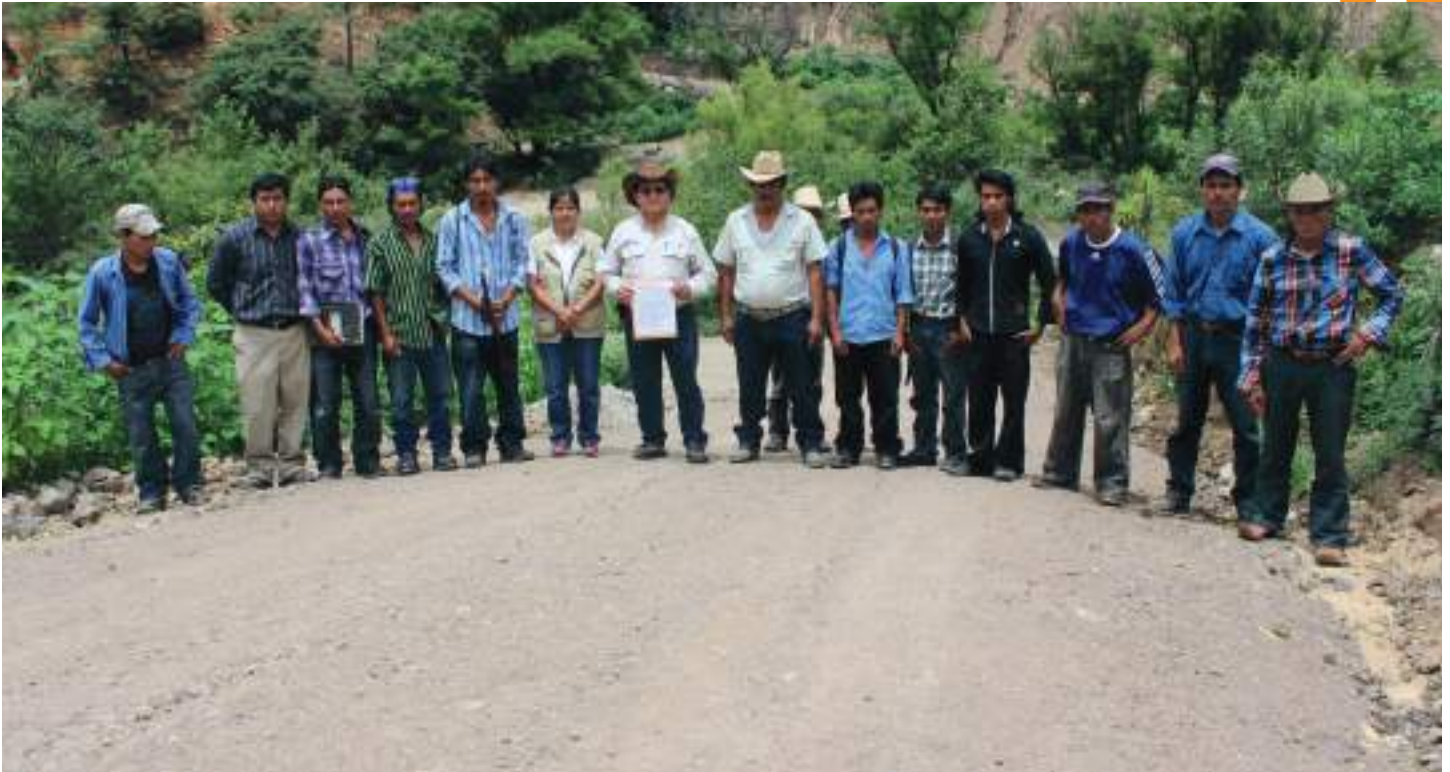
Líderes locales y enviados de la Mina Marlin durante la entrega y recepción de la carretera.