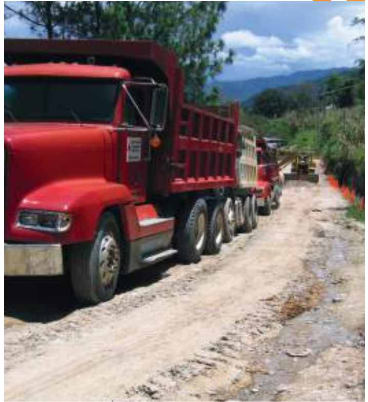
Camiones que movilizaron los materiales útiles para la colocación del asfalto.

en las cercanías de la frontera con México.