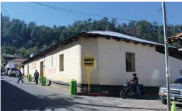
Así era la Casa del Pueblo de San Miguel Ixtahuacan, una edificación de adobe y láminas.