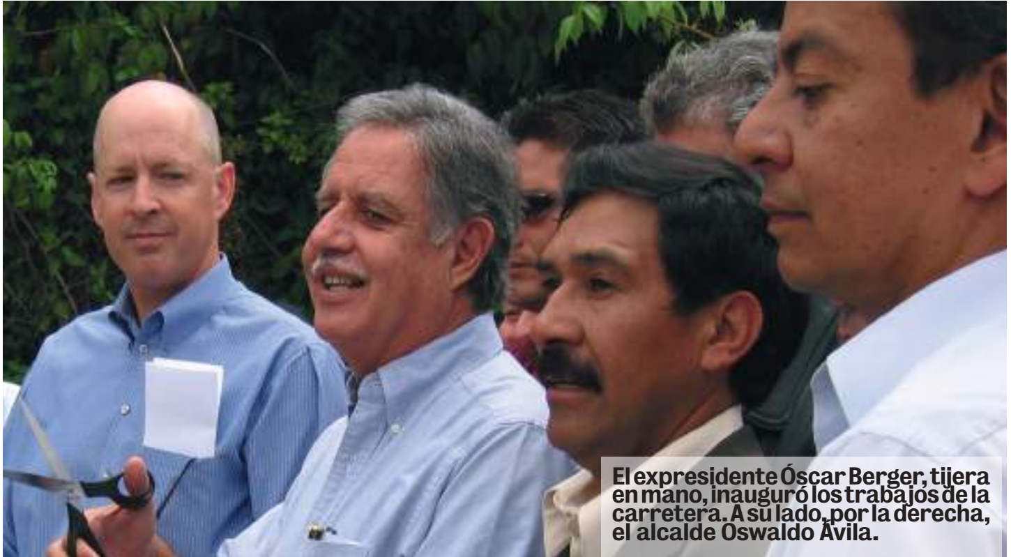
El expresidente Óscar Berger, tijera en mano, inauguró los trabajos de la carretera. A su lado, por la derecha, el alcalde Oswaldo Ávila.

A ntes de que la Mina Marlin iniciará sus operaciones productivas de minerales preciosos en San Miguel Ixtahuacán, San Marcos, los vecinos de este municipio tardaban entre 6 y 8 horas para llegar a la cabecera departamental. Eso ya es historia.