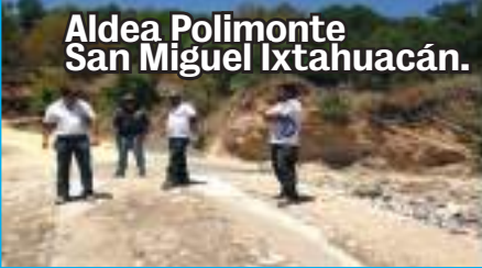
Aldea Polimonte San Miguel Ixtahuacán.