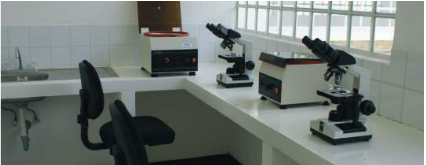
No podía faltar un laboratorio clínico para elaborar los análisis requeridos por el personal médico. No hay necesidad de ir a otras ciudades en busca de este servicio.