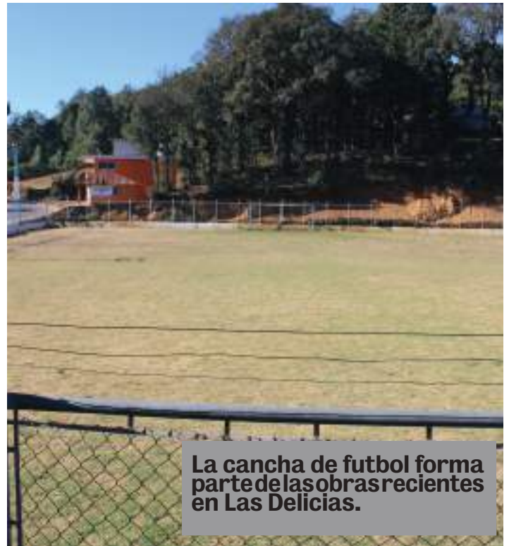
La cancha de fútbol forma parte de las obras recientes en Las Delicias.