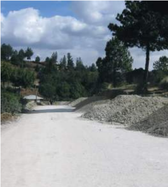
En la etapa de construcción de la carretera, a un lado se observa el acopio de material.