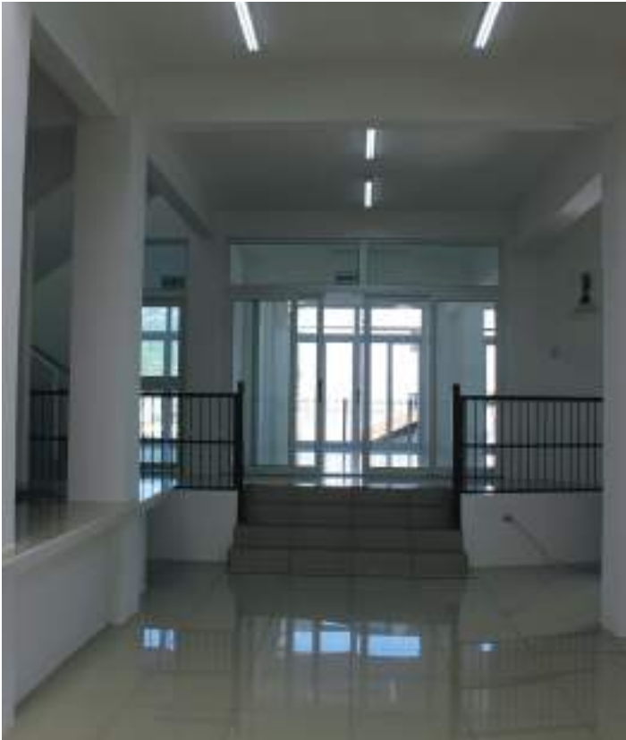
Imagen del ingreso a uno de los salones del primer nivel, desde la puerta de entrada.