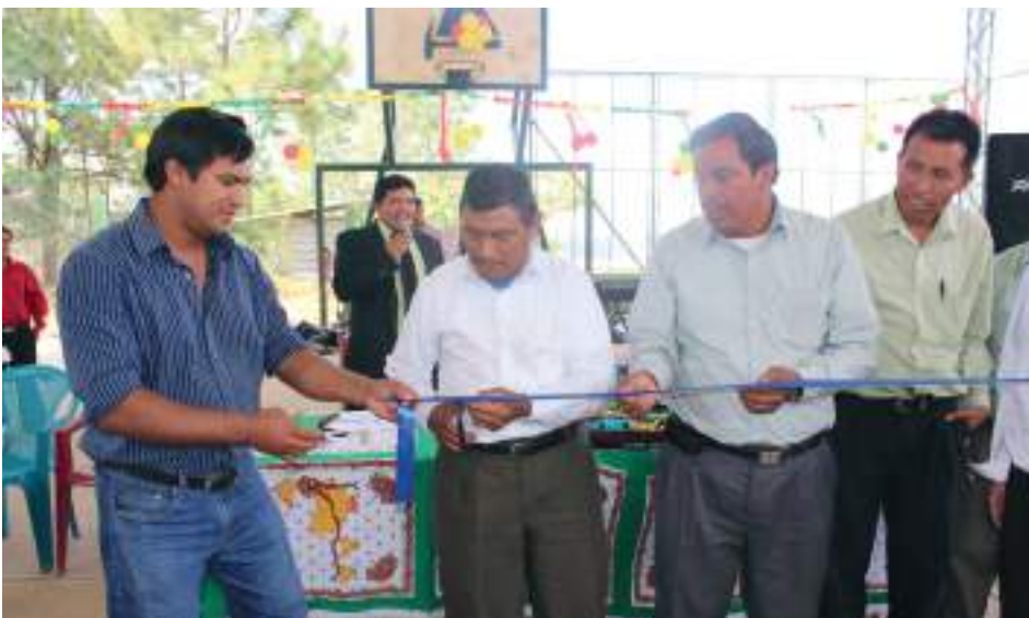
Arriba, imagen con el nuevo techo del parque comunitario. Abajo, inauguración de otra cancha polideportiva.