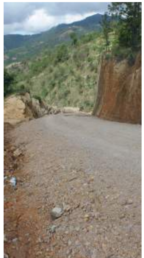
La obra facilita el acceso a la comunidad.