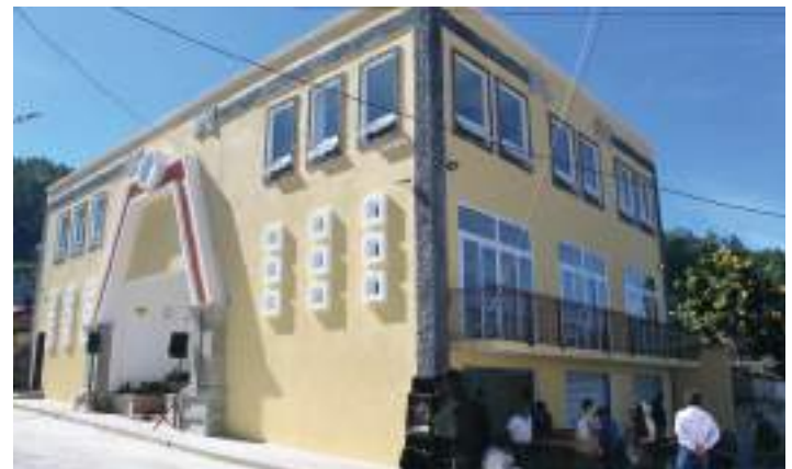
Esta es la nueva obra. Imagen captada desde el mismo lugar de la foto anterior.