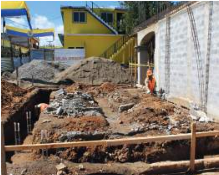
Imagen de la obra cuando estaba en construcción. Se puede ver la calidad de los trabajos.