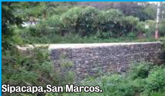
Sipacapa, San Marcos.