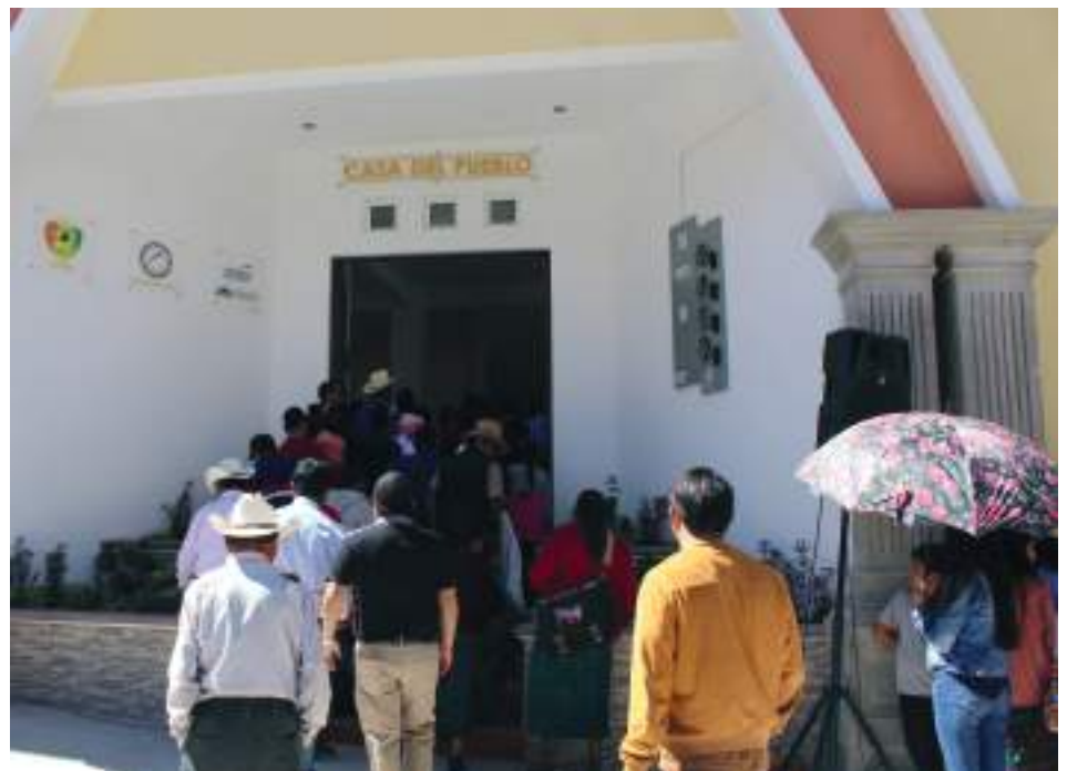
Una buena parte de la población miguelense acudió a ver el interior de la nueva Casa del Pueblo.