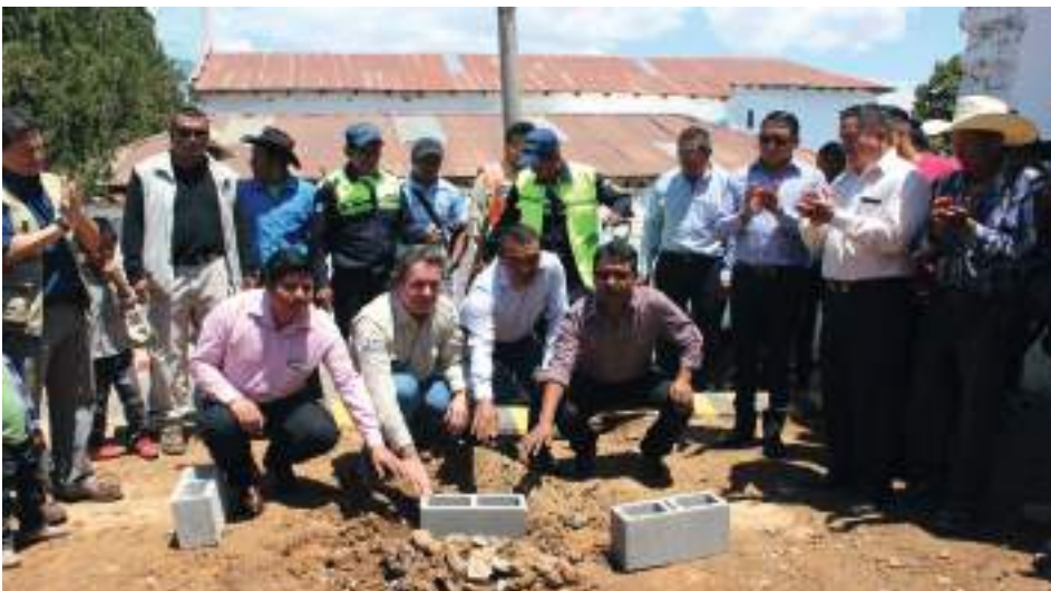
El gerente general del Proyecto de Cierre Marlin (de beige), junto a miembros de la corporación municipal sipacapense.

La obra tiene un amplio corredor para subir al segundo piso. La seguridad personal fue uno de los