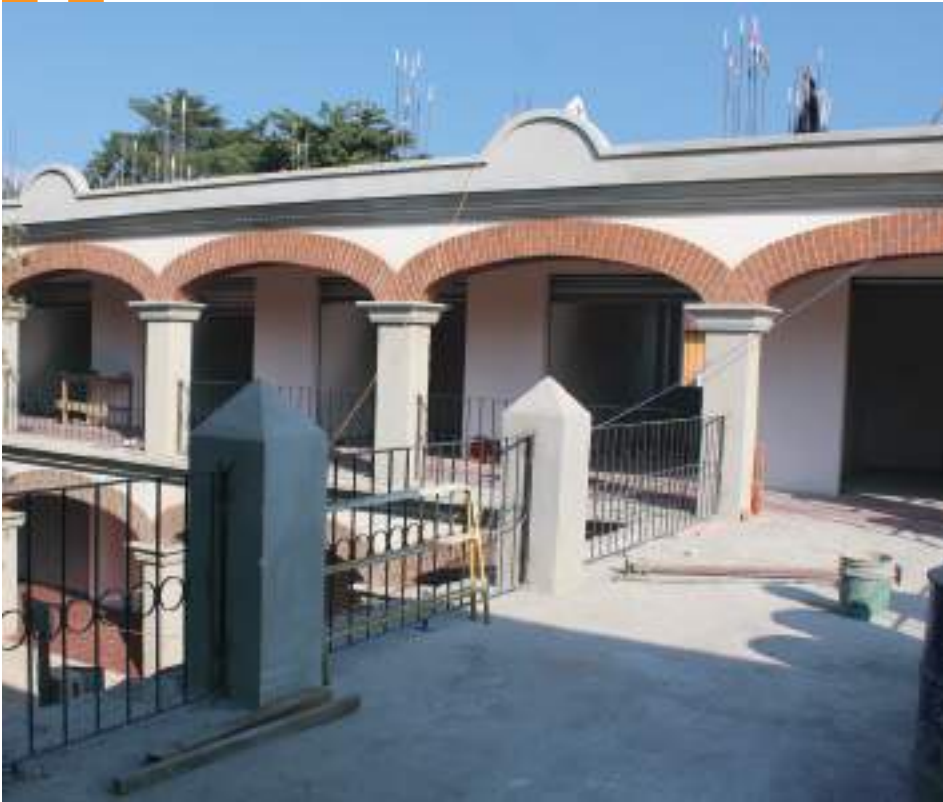
Así estaba el puente que comunica el edificio con las oficinas municipales, en imagen de cuando estaba en construcción.

aspectos más importantes tomados en cuenta durante la edificación, así como en el diseño innovador de la estructura.