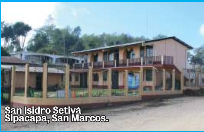
San Isidro Setivá Sipacapa, San Marcos.