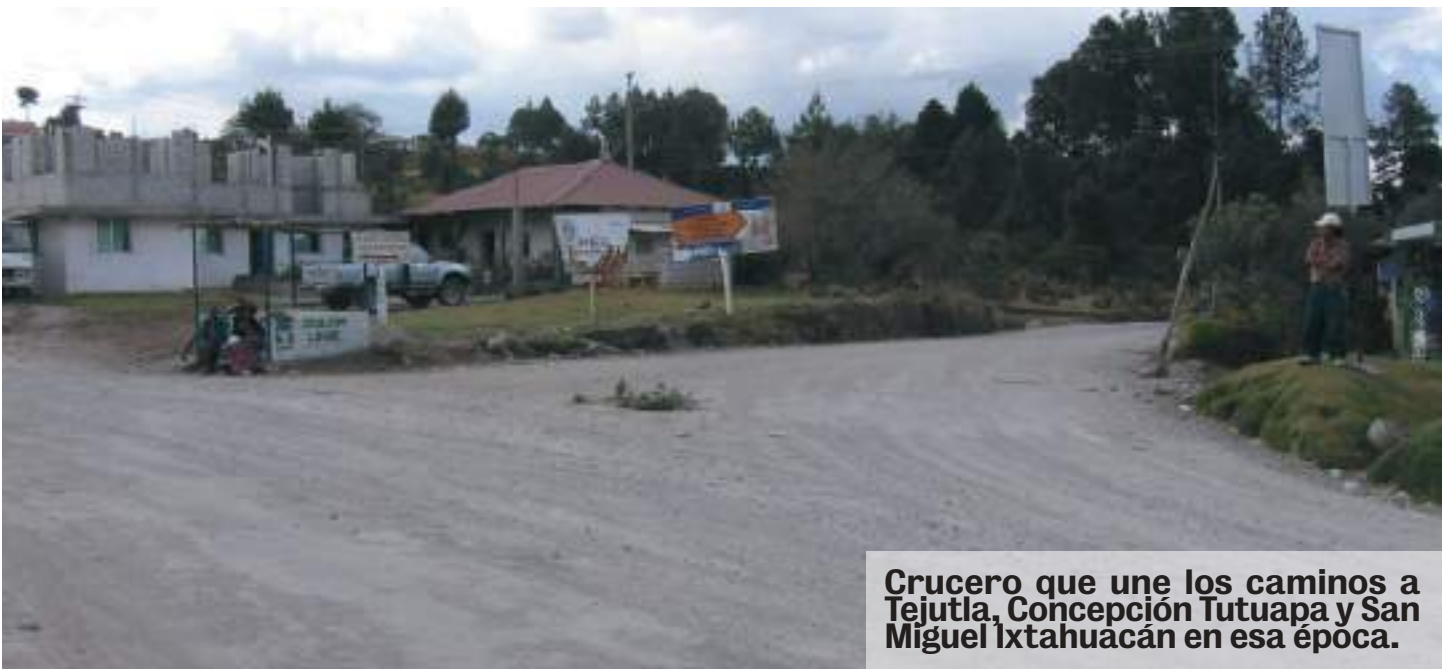
Crucero que une los caminos a Tejutla, Concepción Tutuapa y San Miguel Ixtahuacán en esa época.