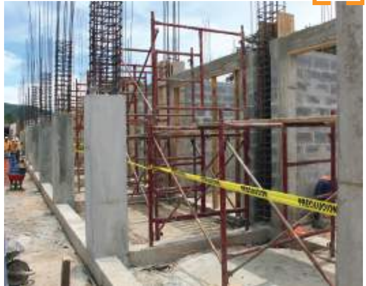
Muros y columnas de alta resistencia son la base del nuevo Edificio Comercial sipacapense.