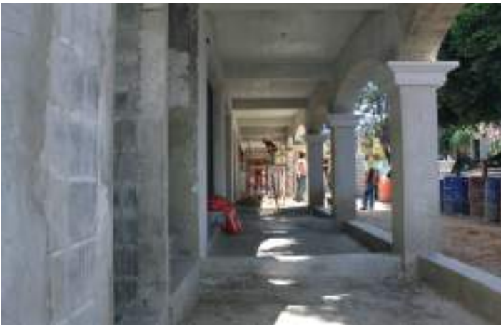
Vista del portal de la obra cuando estaba en ejecución, a mediados del año pasado .