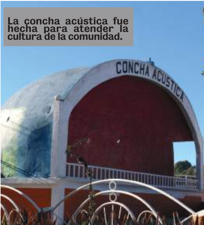
La concha acústica fue hecha para atender la cultura de la comunidad.