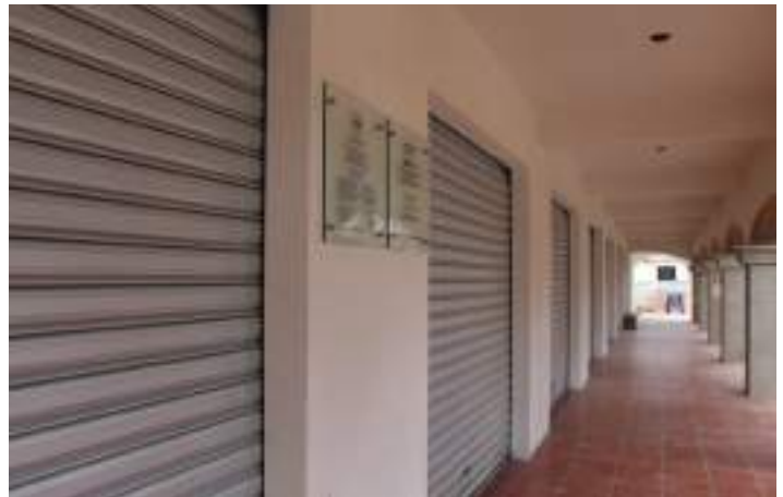
El mismo sitio de la imagen anterior, luego de la colocación de pisos y persianas.

La obra tiene un amplio corredor para subir al segundo piso. La seguridad personal fue uno de los