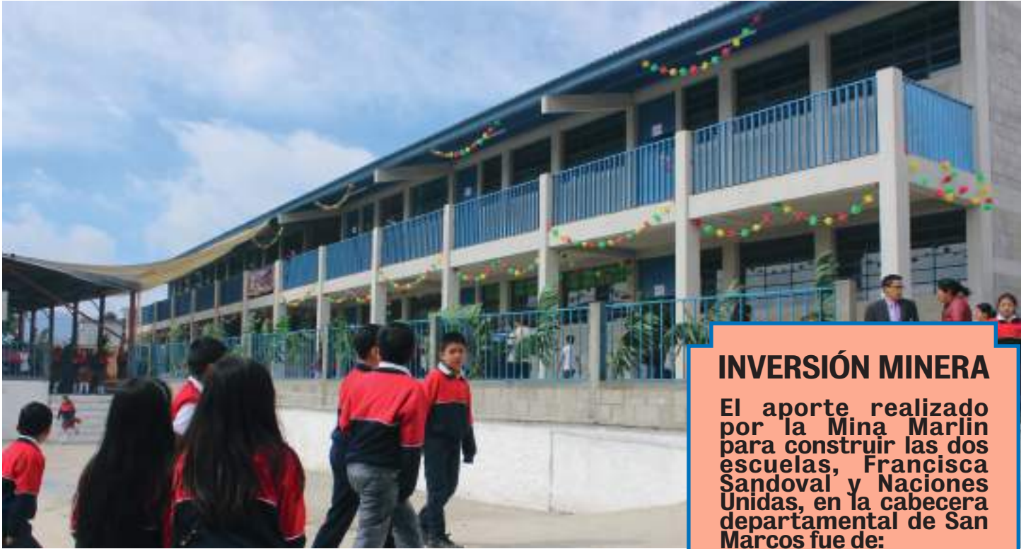
La Escuela de Educación Primaria Naciones Unidas de la cabecera de San Marcos, obra financiada por la mina.

E l 17 de noviembre de 2012, la población de la cabecera departamental de San Marcos pasó por un momento trágico: un terremoto que destruyó una buena parte de la infraestructura, entre los que se encontraban los edificios escolares.