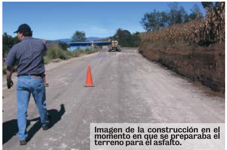
Imagen de la construcción en el momento en que se preparaba el terreno para el asfalto.

terrestre con la cabecera departamental de Huehuetenango. La otra hacia los municipios huehuetecos de San Gaspar Ixil y Colotenango, y se une con la Interamericana,