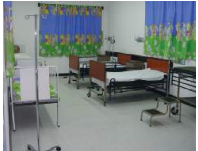
El área de camas para las señoras que han dado a luz a sus bebés.