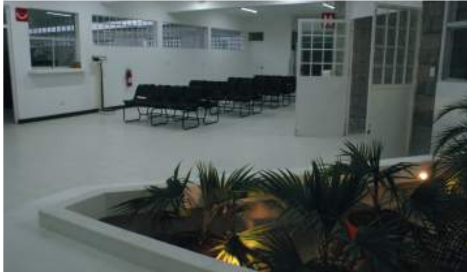
En la sala de espera de la consulta externa. Se observa un lugar agradable y bien acondicionado.