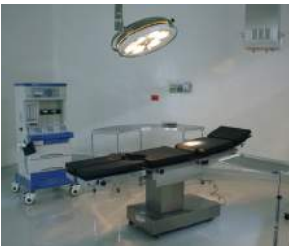
Otra parte del quirófano para atender a los pacientes miguelenses.