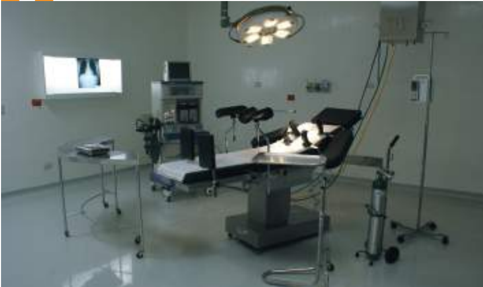
El quirófano es otro salón importante para prestar servicios a la comunidad de la región del norte de San Marcos.

el Gobierno Central se hizo cargo de los salarios del personal y de ciertos insumos. En total, desde el inicio de la construcción y los aportes de insumos y salarios, Montana Exploradora financió el proyecto con Q27.7 millones hasta fines del año 2014.