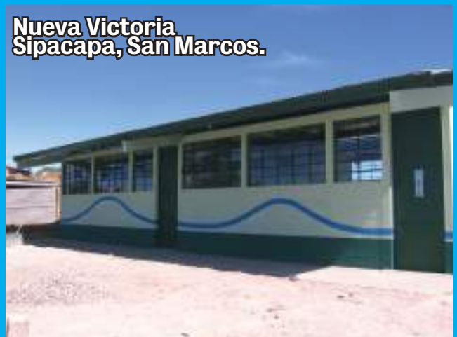
Nueva Victoria Sipacapa, San Marcos.