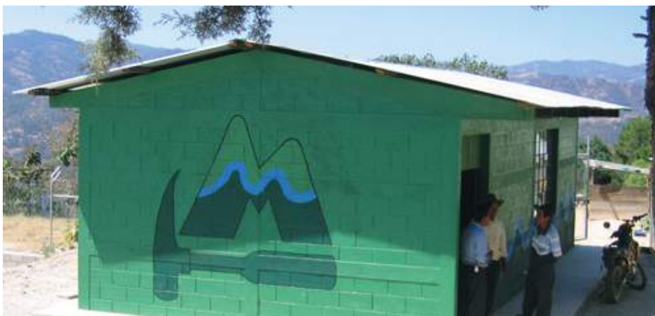
Una cocina escolar para los estudiantes de Chuena.