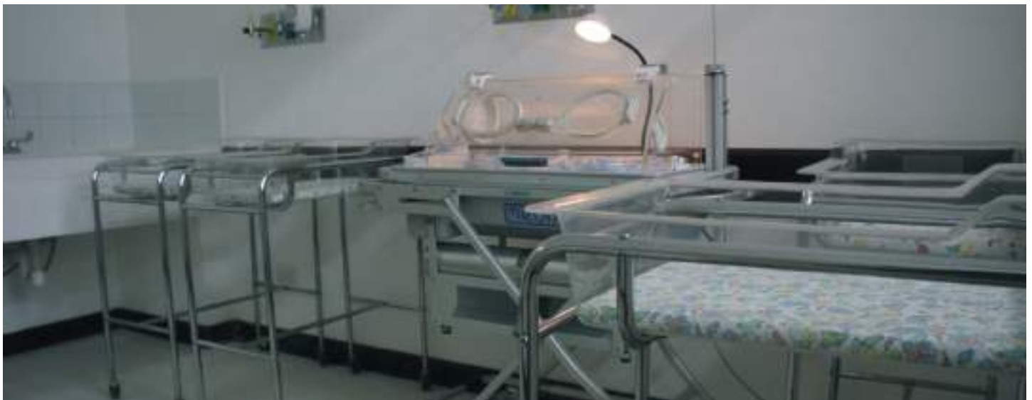
Una sala donde se atiende a los recién nacidos, lo cual da una idea de los excelente servicios que se pueden prestar en este centro hospitalario.

El CAP ha quedado ya en manos del Ministerio de Salud Pública y Asistencia Social, por lo que puede prestar servicios a los habitantes de los municipios vecinos, tanto del departamento de San Marcos, como de Huehuetenango.