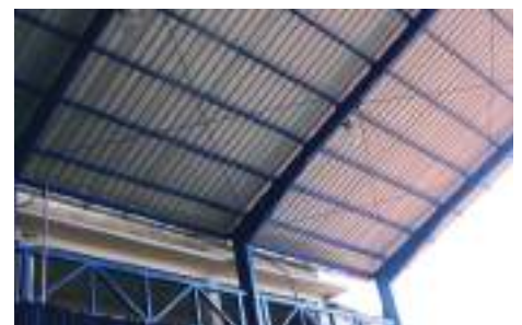
Parte del techo colocado en las escuelas de San Pedro Sac.