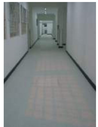
Por los pasillos del CAP, una imagen sanitaria.