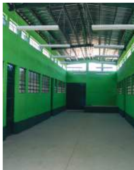
El interior de la escuela entregada por la Mina Marlin.

obra no calificada. Es decir, fue un proyecto tripartito.