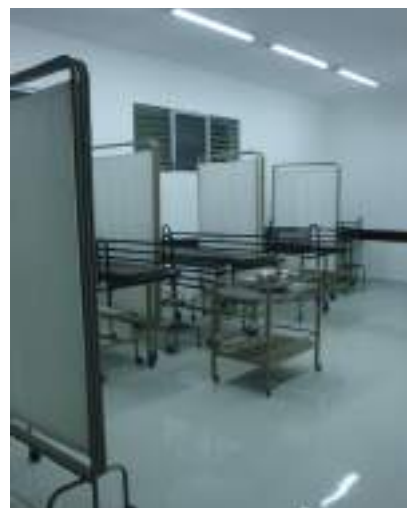
Otro salón para prestar los servicios hospitalarios.