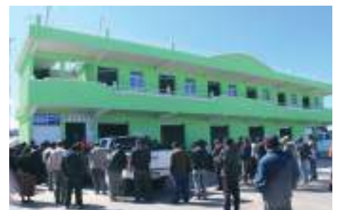
El centro comercial con doce locales para negocios.