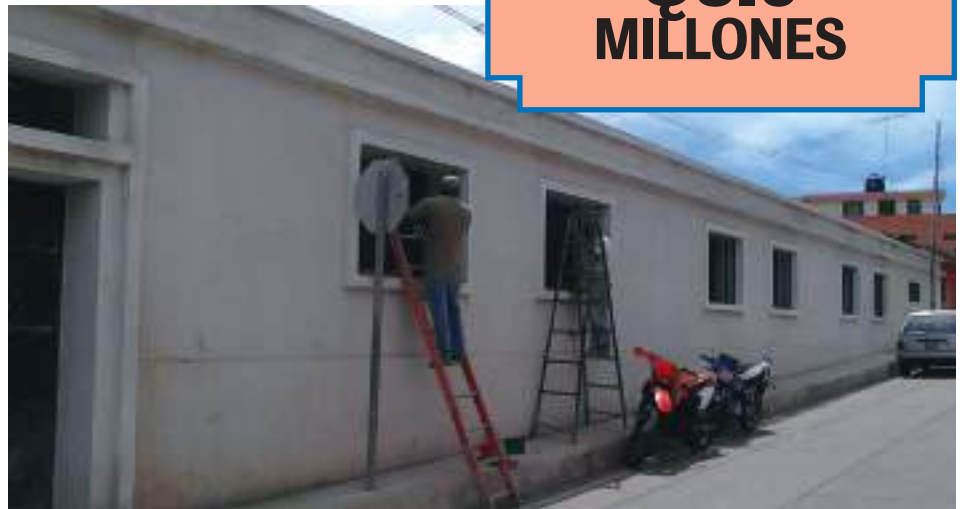
La Escuela de Educación PrePrimaria Francisca Sandoval en la ciudad de San Marcos, en la etapa de la reconstrucción.

Luego de una larga espera, debido a retrasos del Gobierno a fines de 2015 la construcción de la Escuela Francisca Sandoval ya había sido concluida, luego de ejercer las presiones correspondientes para