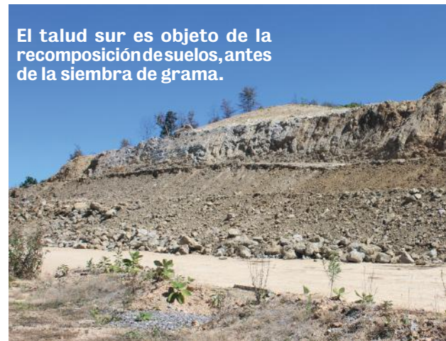
El talud sur es objeto de la recomposición de suelos, antes de la siembra de grama.