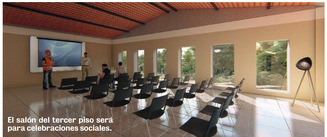
El salón del tercer piso será para celebraciones sociales.

En el tercer piso funcionará el salón más grande. Según el