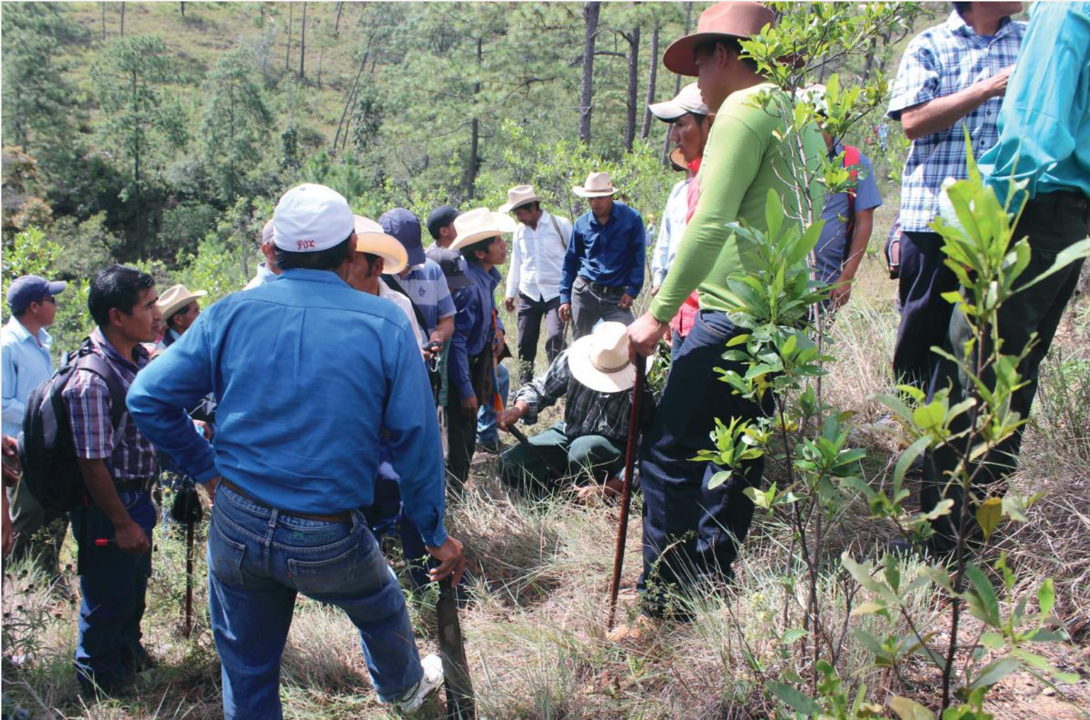
El proceso de donación de terrenos al caserío Salem, Sipacapa, se inició a finales del año pasado.

APORTE A COMUNIDADES: Aunque la Mina Marlin ya no está en producción mantuvo su apoyo a los vecinos en 2017.