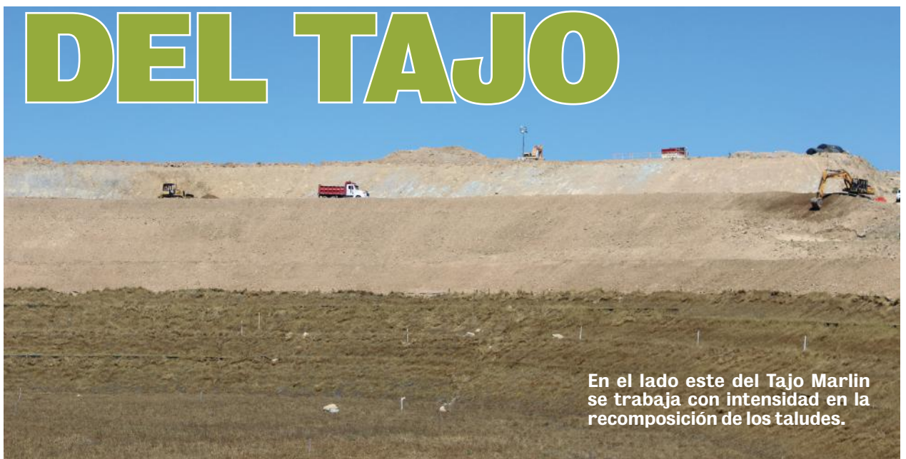
En el lado este del Tajo Marlin se trabaja con intensidad en la recomposición de los taludes.