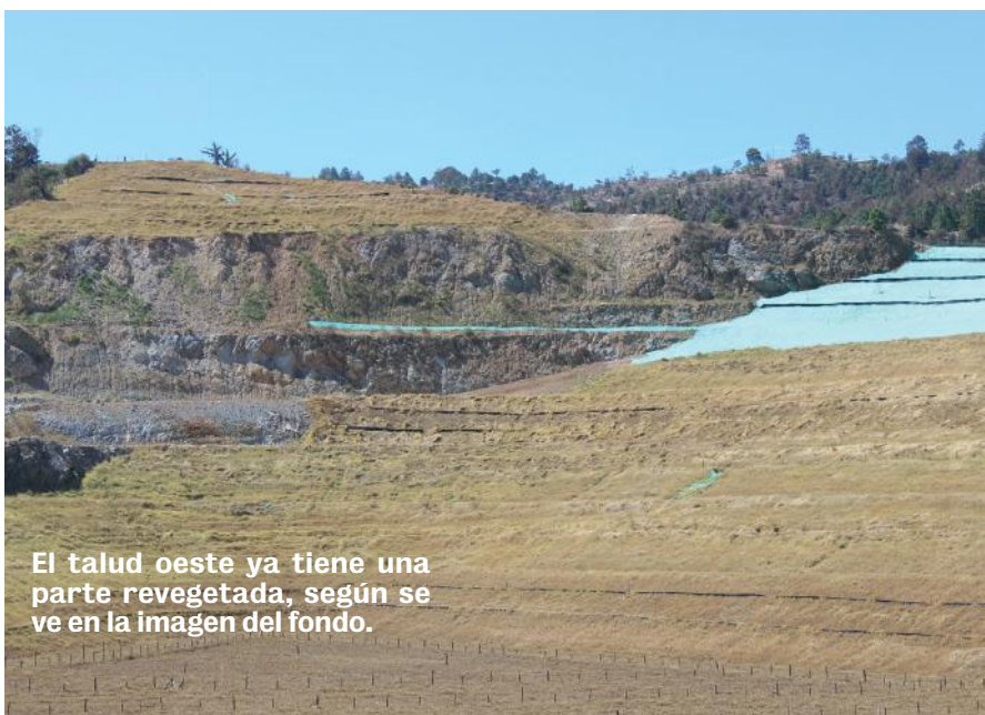
El talud oeste ya tiene una parte revegetada, según se ve en la imagen del fondo.