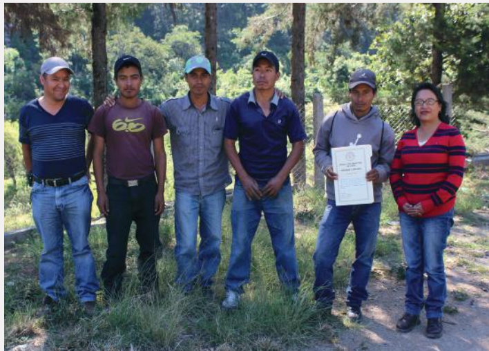
Los miembros del COCODE de Los Chocoyos el día en que recibieron las escrituras de propiedad comunitaria.

de letrinas y sumideros para contribuir así con la salud de los habitantes del lugar.