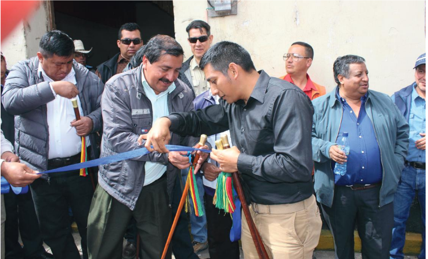
Alcaldes comunitarios de San Miguel Ixtahuacán en el corte de la cinta simbólica para celebrar la firma del convenio.

E l 18 de febrero de este año fue un día de fiesta para los vecinos de San Miguel Ixtahuacán. Se firmó el convenio entre la gerencia general de la Mina Marlin y las autoridades de las alcaldías comunitarias y miembros de las 80 cofradías del municipio, todo esto con el aval de la municipalidad de San Miguel. La empresa se comprometió a construir un nuevo edificio para la Casa del Pueblo.