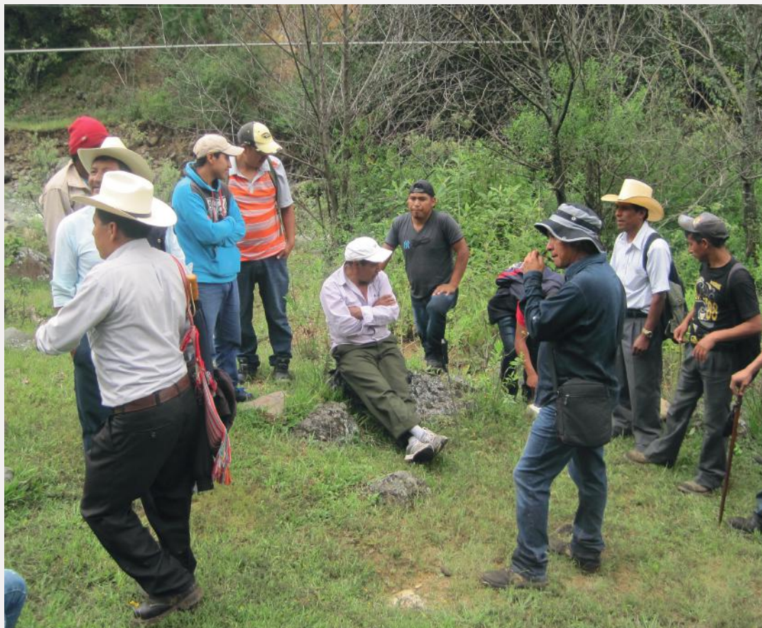
Los vecinos de aldea Cancil también verificaron límites de tierras el año pasado.