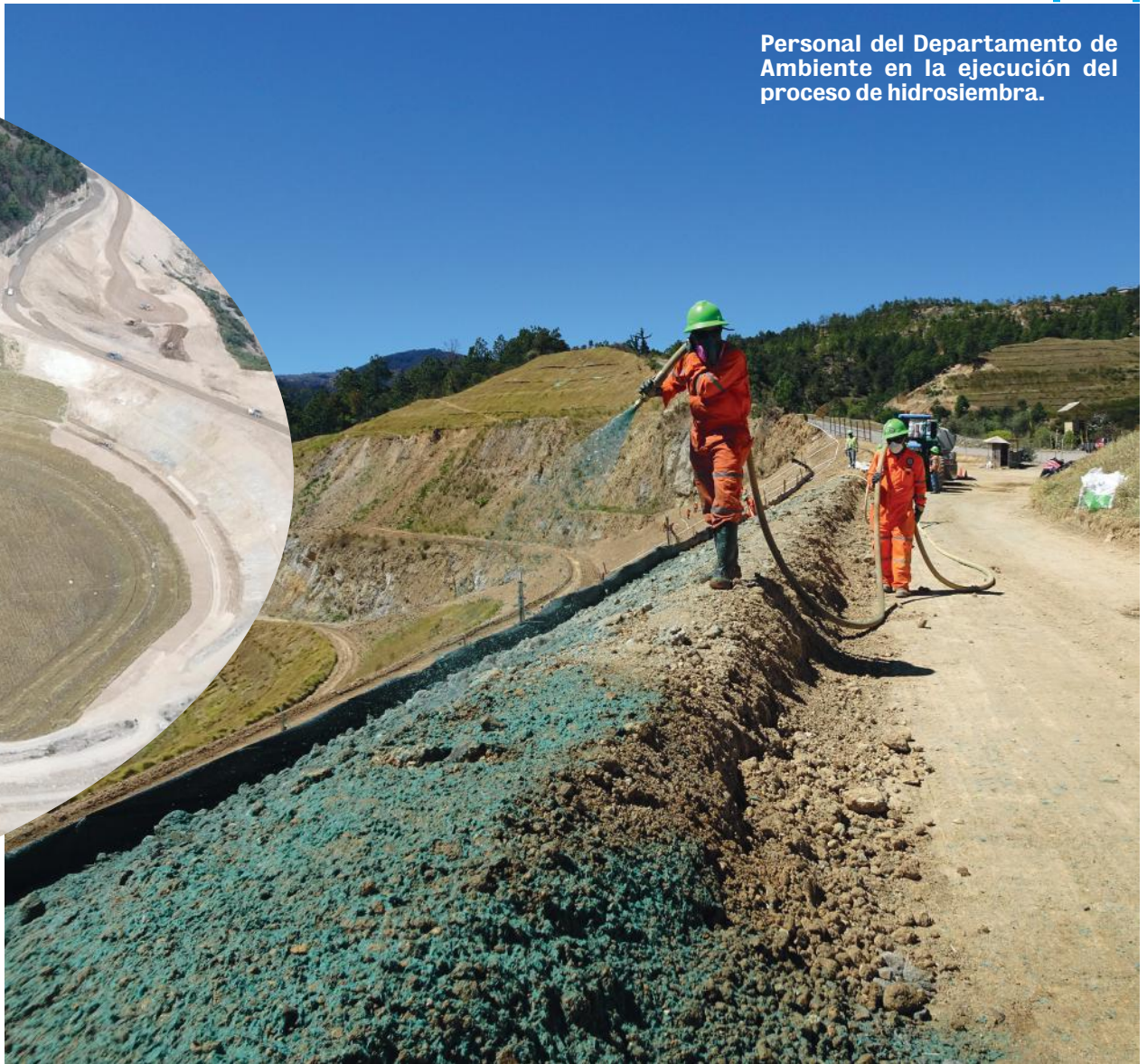
Personal del Departamento de Ambiente en la ejecución del proceso de hidrosiembra.