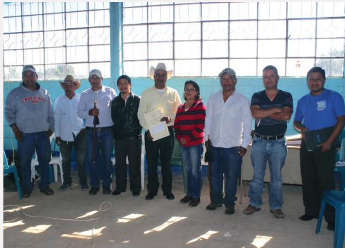
Los directivos del COCODE de la aldea Pie de la Cuesta también obtuvieron en la misma fecha las escrituras legalizadas.