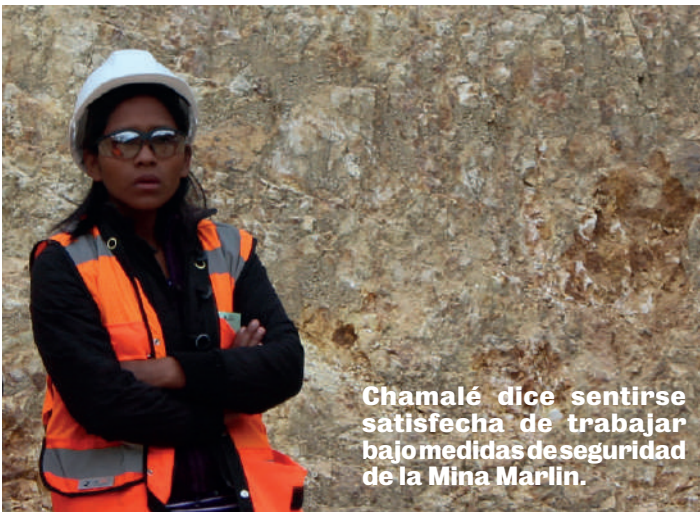
Chamalé dice sentirse satisfecha de trabajar bajo medidas de seguridad de la Mina Marlin.

E n la Mina Marlin cada vez que hay oportunidad, las mujeres asumen papeles de responsabilidad que parecen estar destinados solo a personal masculino.