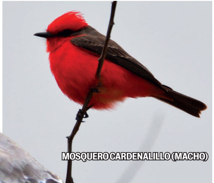
MOSQUERO CARDENALILLO (MACHO)

L a protección de los bosques vecinos a la Mina Marlin ha permitido el fortalecimiento de la biodiversidad. De acuerdo con los registros del Departamento de Ambiente en eBird, a finales del año pasado se había identificado a 150 especies de aves.