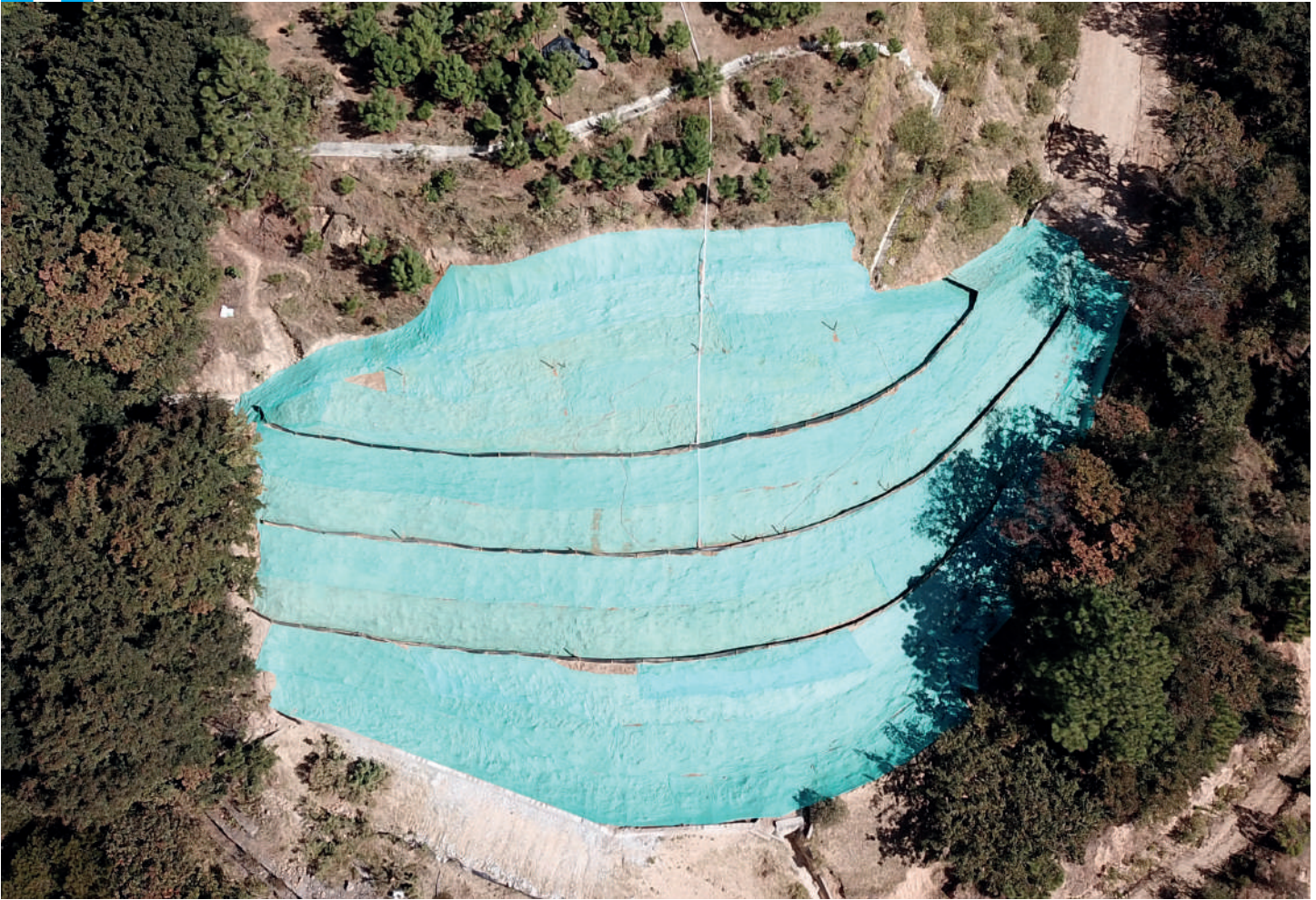
El Portal West Vero fue sometido al proceso de hidrosiembra. En poco tiempo germinarán las semillas de grama.