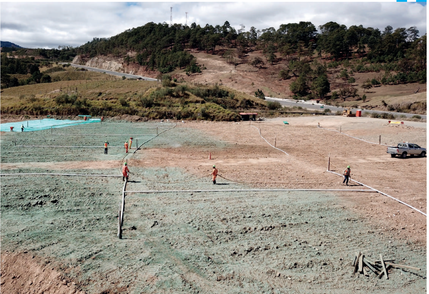
Los trabajadores iniciaron la siembra de grama en la cobertura de la represa. El área cuenta con un sistema de riego.