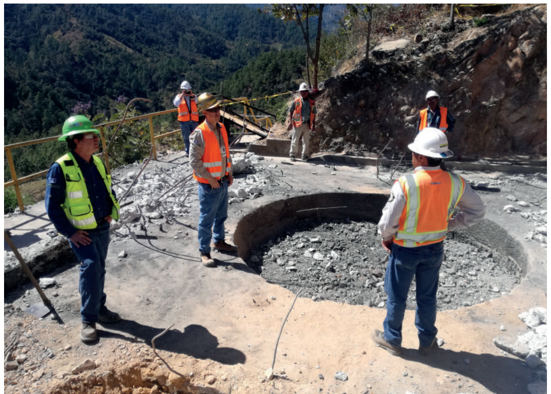
Los encargados del cierre técnico verifican obras para cerrar las chimeneas.

Estas obras forman parte del cierre técnico de la Mina Marlin, y es el cumplimiento de los compromisos acordados con las políticas legales, ambientales y sociales de Montana Exploradora de Guatemala, la empresa operadora del proyecto minero de San Miguel Ixtahuacán, San Marcos.