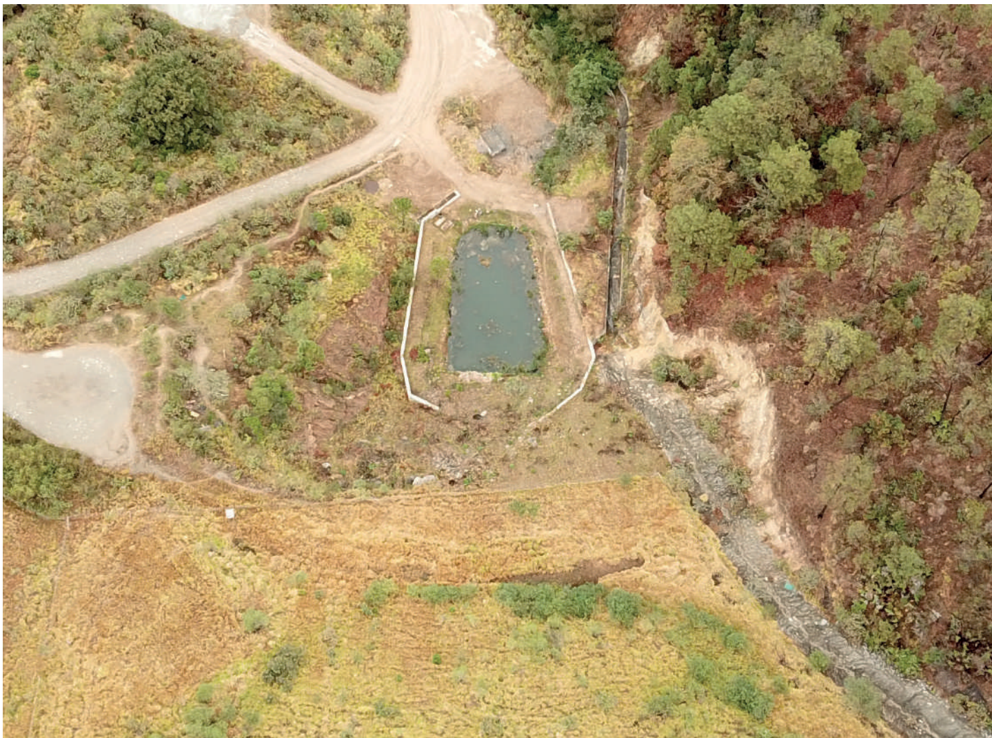
Vista aérea del Seepage Pond. El estanque recolecta agua de lluvia y está rodeado de zonas boscosas y revegetadas.