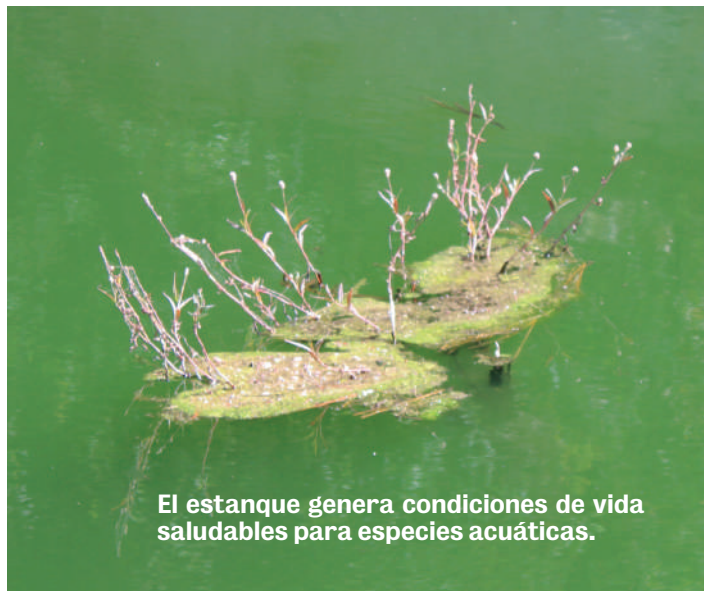
El estanque genera condiciones de vida saludables para especies acuáticas.

Alrededor del Seepage Pond existe un bosque donde muchas especies animales han hecho su hogar. Con la ampliación del canal y otras obras que están en construcción, sin duda, el brillo del color verde será más intenso.