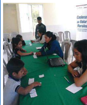
Niños de escuelas con apoyo minero ganan concurso.