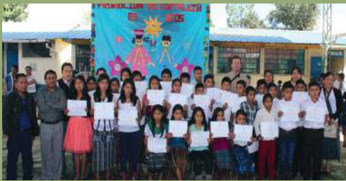
Grupo de graduados de sexto Primaria de la Escuela de Ágel, junto con sus padrinos.