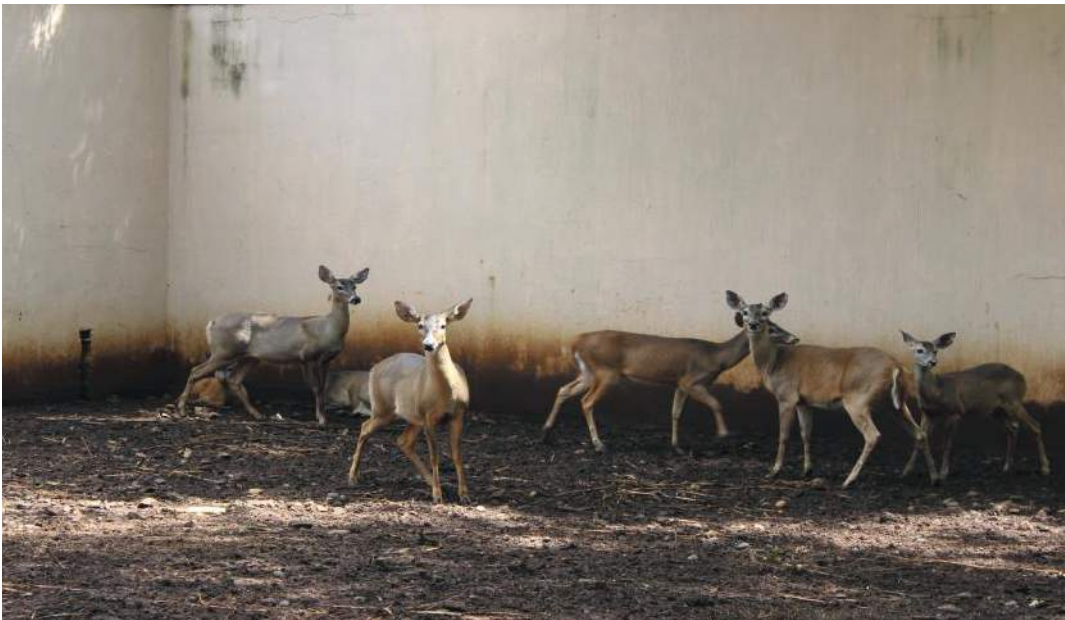
En Hacienda Vado Hondo se protege a los venados cola blanca, entre ellos los de Mina Marlin.

E n octubre, los habitantes de la reserva de venados cola blanca de la Mina Marlin partieron hacia su nuevo hogar: la Hacienda Vado Hondo, municipio de San Lorenzo Suchitepéquez, en la costa del Pacífico.