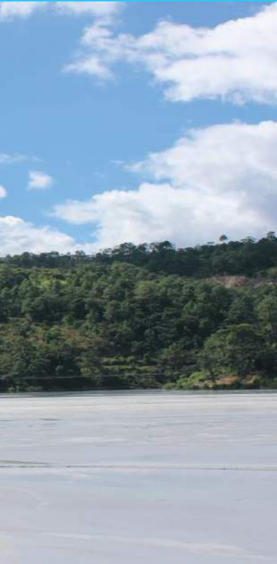
Desde una casa de instrumentación.

L os ingenieros de la Mina Marlin, se preocuparon por construir una sólida represa de colas, ahora se disponen a cerrarla con profesionalismo. Y se enfocan en preparar condiciones para plantar un bosque en las 47.3 hectáreas que conforman ese lugar.