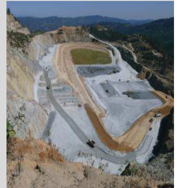
Enero de 2016.