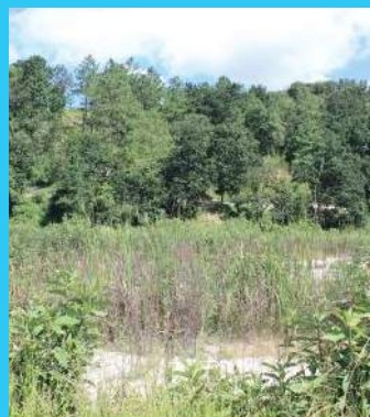
Lugar donde se hacen ensayos piloto de revegetación.