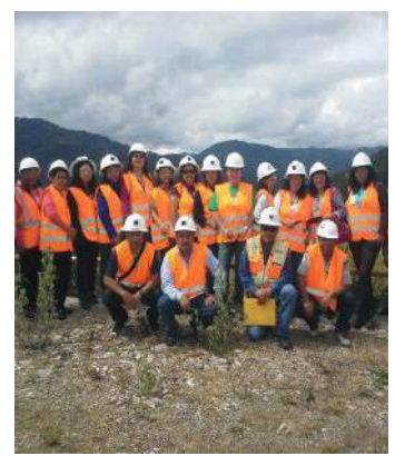
Profesores sampedranos recorrieron sitios mineros.

Un grupo de 21 educadores de San Pedro Sacatepéquez, San Marcos, visitó la Mina Marlin el 18 de octubre. Llegaron 17 profesoras y 4 maestros de diferentes escuelas, quienes estuvieron en las oficinas del Departamento de Desarrollo Sostenible y en las minas de superficie y subterránea. Recibieron información del Departamento de Ambiente y quienes los atendieron les aclararon las dudas sobre la minería, por lo que al final agradecieron la transparencia con que fueron recibidos.