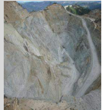
Enero de 2012.