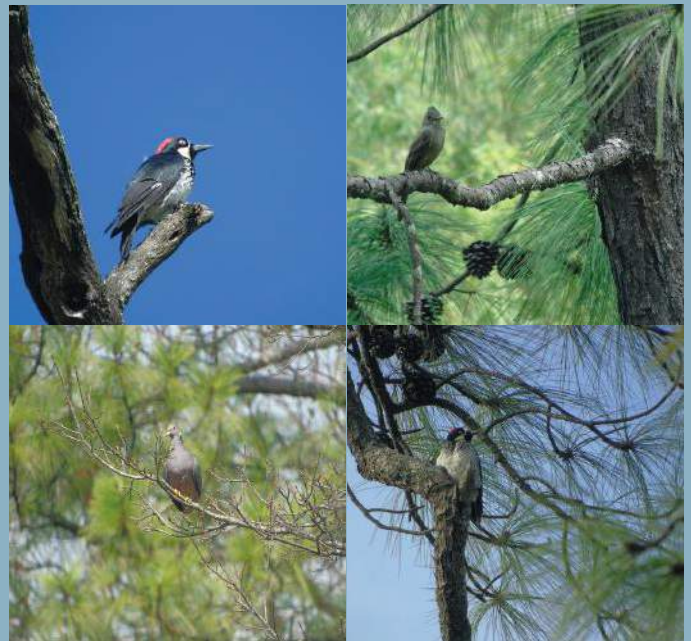
La flora y la fauna en los alrededores de la Mina Marlin pueden ser investigados bajo parámetros científicos con propósitos académicos.