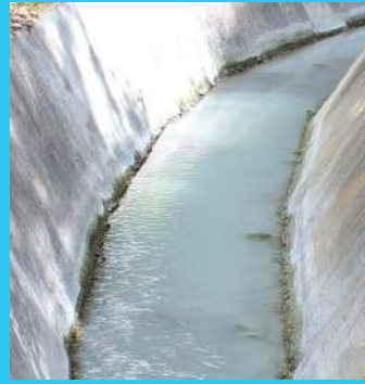
El lugar está protegido por 4 kilómetros de canales.

En las tareas de recomposición ambiental participarán ingenieros civiles y agrónomos, así como topógrafos y laboratoristas de suelos.