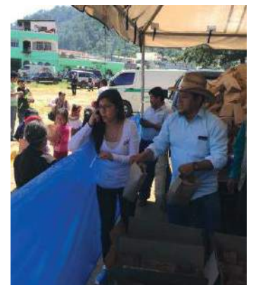
Personal de Mina Marlin lleva alegría a los estudiantes.

Del 25 de septiembre al 1 de octubre se celebra la feria patronal de San Miguel Ixtahuacán, San Marcos. Como se viene realizando desde el año 2004, la Mina Marlin, representada por la Unidad de Relaciones Comunitarias, entregó 5 mil refrigerios a los estudiantes que desfilaron los días 26 y 27 de septiembre. El 26 a los alumnos del área urbana se les entregaron 2 mil refacciones y el 27 fue el turno de los alumnos del área rural, quienes recibieron 3 mil.