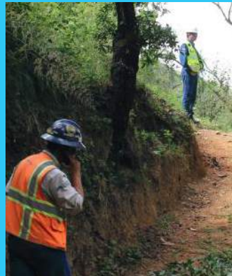
Camino desde donde se hacen controles de todo tipo.