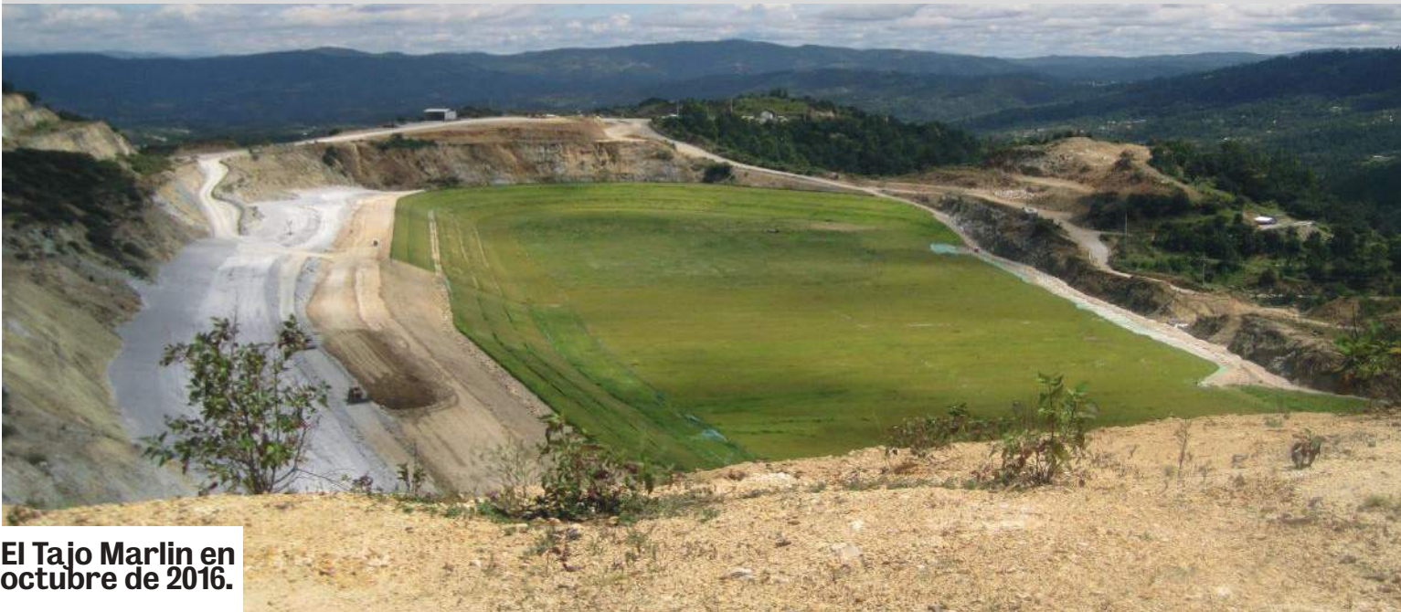
El Tajo Marlin en octubre de 2016.