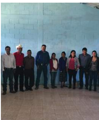
Maestros agradecieron la entrega de materiales.