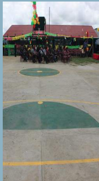
La cancha será utilizada para esparcimiento de la juventud de El Progreso.

El martes 18 de octubre la Mina Marlin entregó una Cancha Polideportiva al caserío El Progreso Venecia, en Tejutla, San Marcos, un motivo de fiesta en la comunidad.