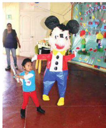
Los pequeños de la Casa Cuna celebraron el Día del Niño.