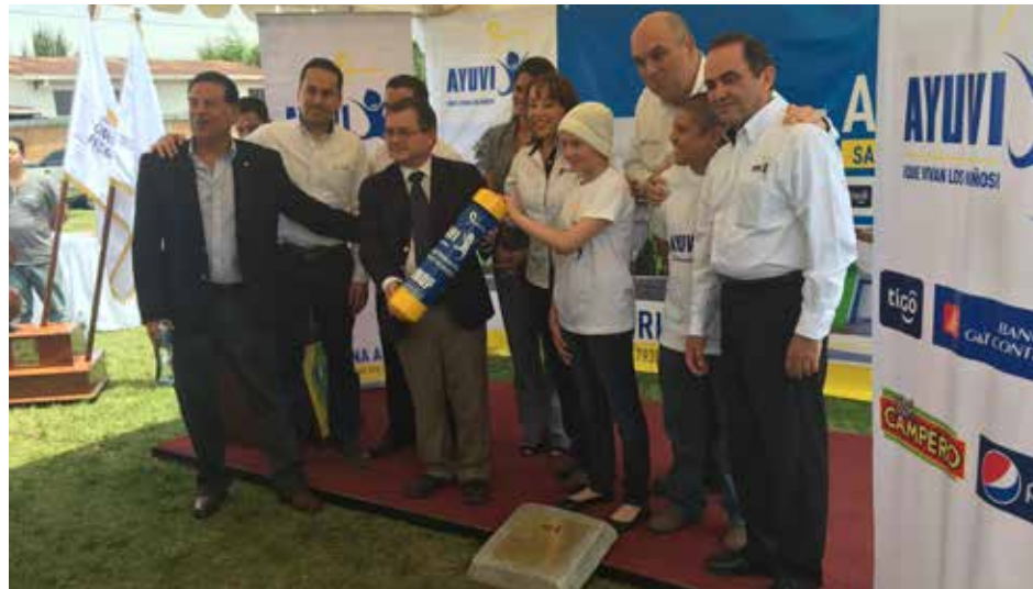
Equipo de AYUVI, empresarios y uno de los niños que recibe tratamiento en esa institución, preparan colocación de primera piedra del hospital contra el cáncer.

“Se escogió a AYUVI, debido a que el nuevo hospital ayudará a familias de la región occidental, que así evitarán trasladarse a la capital para recibir tratamiento, incluyendo a los niños del depar-