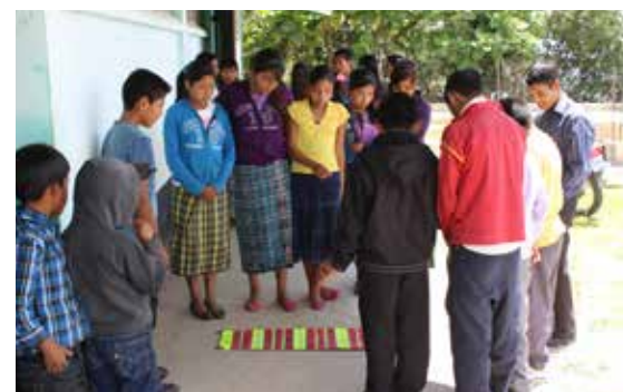
Las actividades al aire libre oxigenan la imaginación de los alumnos, además de hacerles mantener la atención.