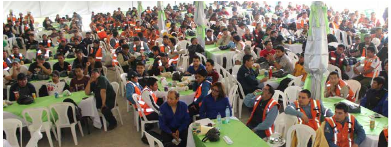
Los mineros degustaron un delicioso almuerzo acompañado de un show musical, concursos y rifas para festejar su valiosa contribución dentro de la industria.