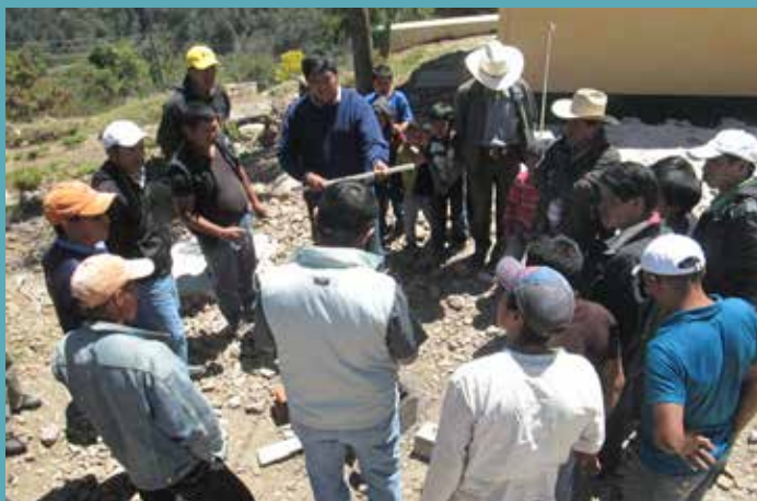
A los comunitarios se les explicó el correcto mantenimiento que se le debe dar a la tubería que conduce el vital líquido.

Los técnicos que conforman las UTAS reportan que ha habido avances en diferentes porcentajes en cuanto a la impartición de las capacitaciones, pero se tiene contemplado concluir con el proceso en el menor tiempo posible.