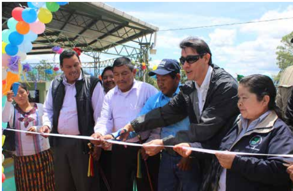
Autoridades municipales y comunitarias, miembros de la Mina Marlin y personeros de INFOM, realizan el corte de inauguración del proyecto de agua.