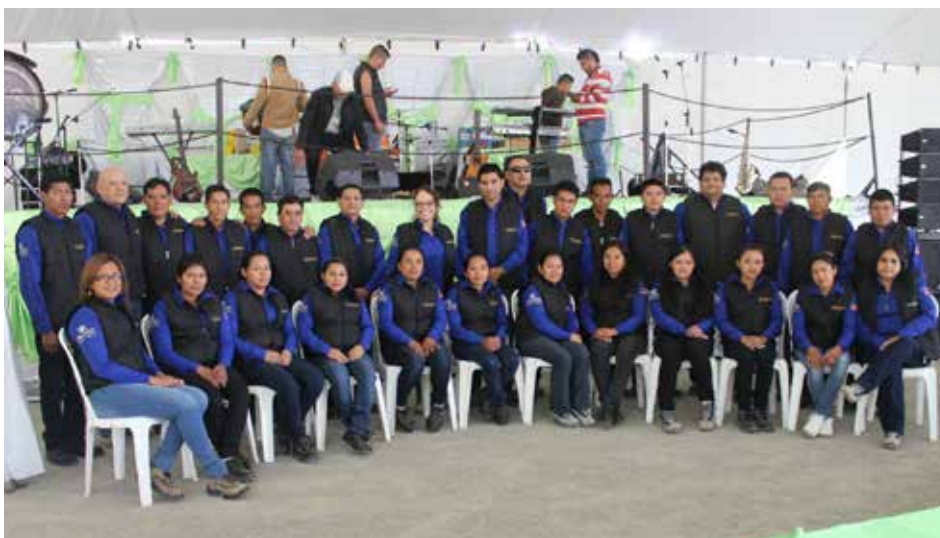
El equipo de Recursos Humanos hizo posible la celebración minera.