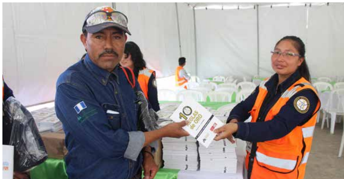
Durante la celebración del Día del Minero, se hizo entrega de las 10 Reglas de Oro Ilustradas a todos los asistentes al evento.

En agosto, como parte del programa para fortalecer la seguridad, Montana Exploradora distribuyó la Guía de Oro Ilustrada, una recopilación con ejemplos gráficos de las 10 Reglas de Oro que norman las actividades dentro de la Mina Marlin.