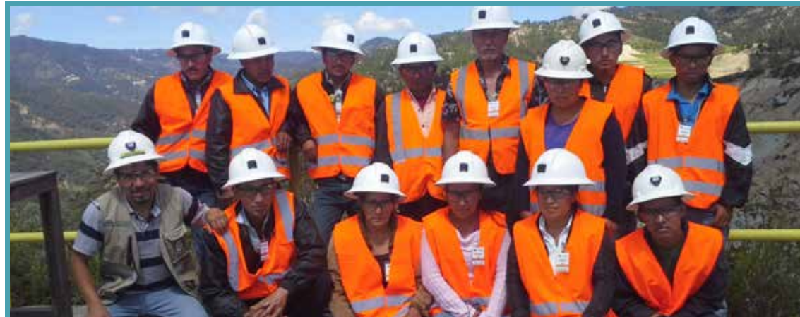
Líderes comunitarios del caserío Los López del municipio de Sipacapa, recorrieron las instalaciones mineras y conocieron de primera mano el proceso de extracción de oro y plata.