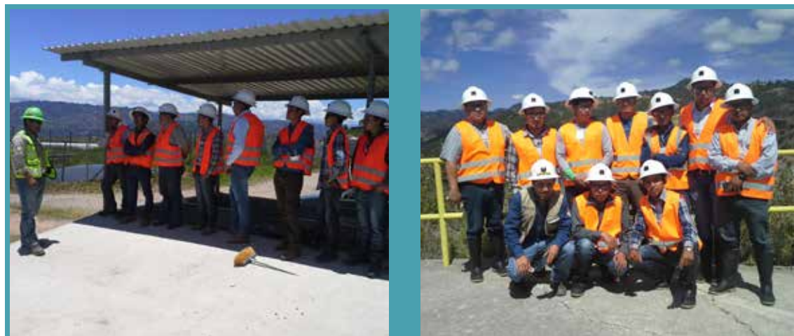
Estudiantes de la Universidad Rural de Chiantla, Huehuetenango, visitaron la Mina Marlin y su principal interés era la gestión ambiental responsable que se realiza en la empresa.