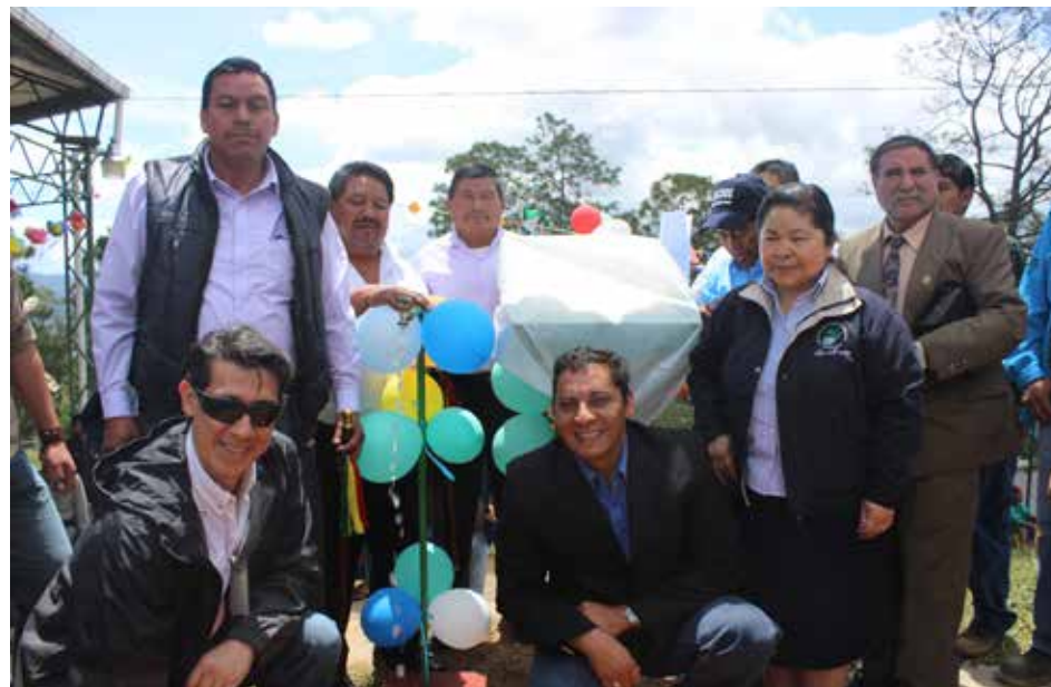
Develación de la placa conmemorativa donde se menciona a las personas involucradas en el proyecto de agua potable de San José Nueva Esperanza.