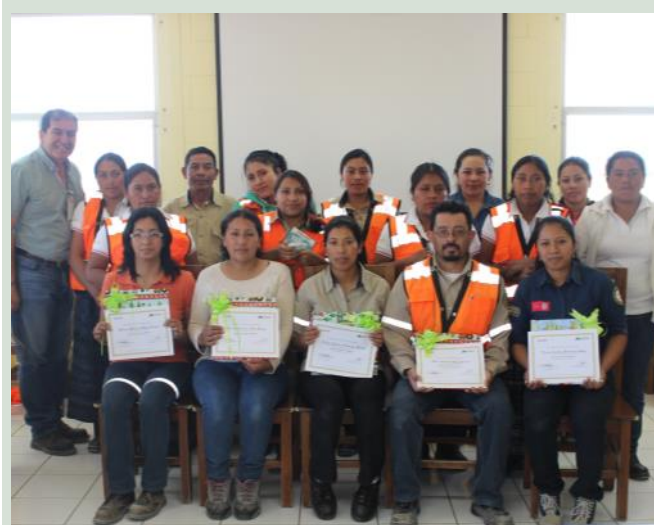
A la clausura del programa asistieron 17 padres mineros. La mina premió a quienes fueron constantes.

Además del Programa de Apoyo a la Vivienda, la Unidad 69kv impulsa otros 3 programas: Mejoramiento de Cultivos, Seguridad Alimentaria y Apoyo a la Educación. 🏡