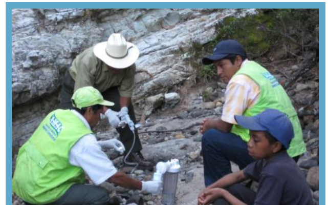
La Asociación de Monitoreo Ambiental (AMAC) realiza monitores constantes de las fuentes hídricas que están en los alrededores y adentro del proyecto minero Marlin.