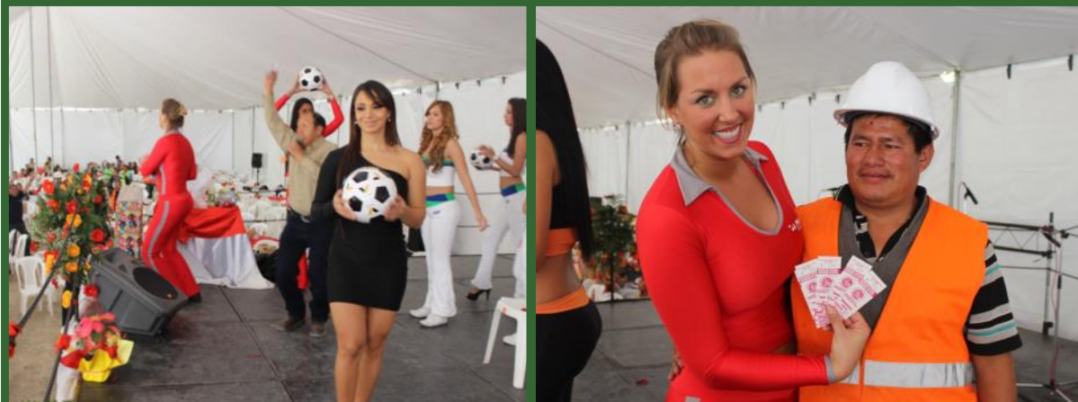
Se regalaron balones con leyendas alusivas a los Pilares Estratégicos de Goldcorp. Las mesas se disputaron a pulso de aplausos y chiflidos las entradas para el juego del Deportivo Marquense contra Municipal.