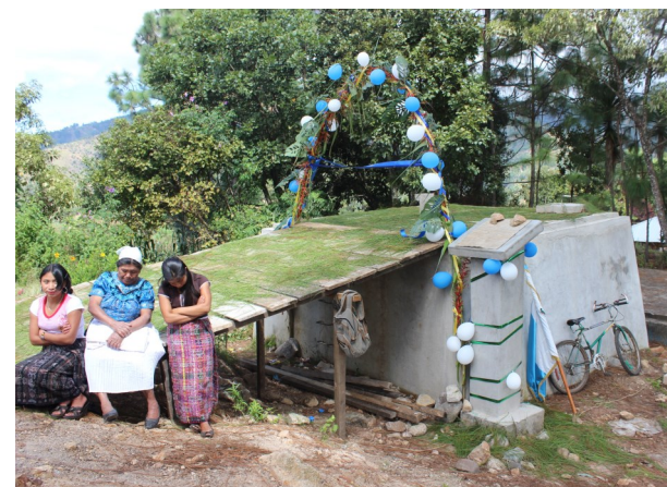
Tanque de captación del proyecto de agua entubada del caserío Chuén, Santa Bárbara.

El presidente de Cocode agradeció a los vecinos del caserío El Potrero, Santa Bárbara, porque esa comunidad les concedió el permiso de paso, sin cobro alguno, para que pase la tubería que conduce el vital líquido hacia Chuén.