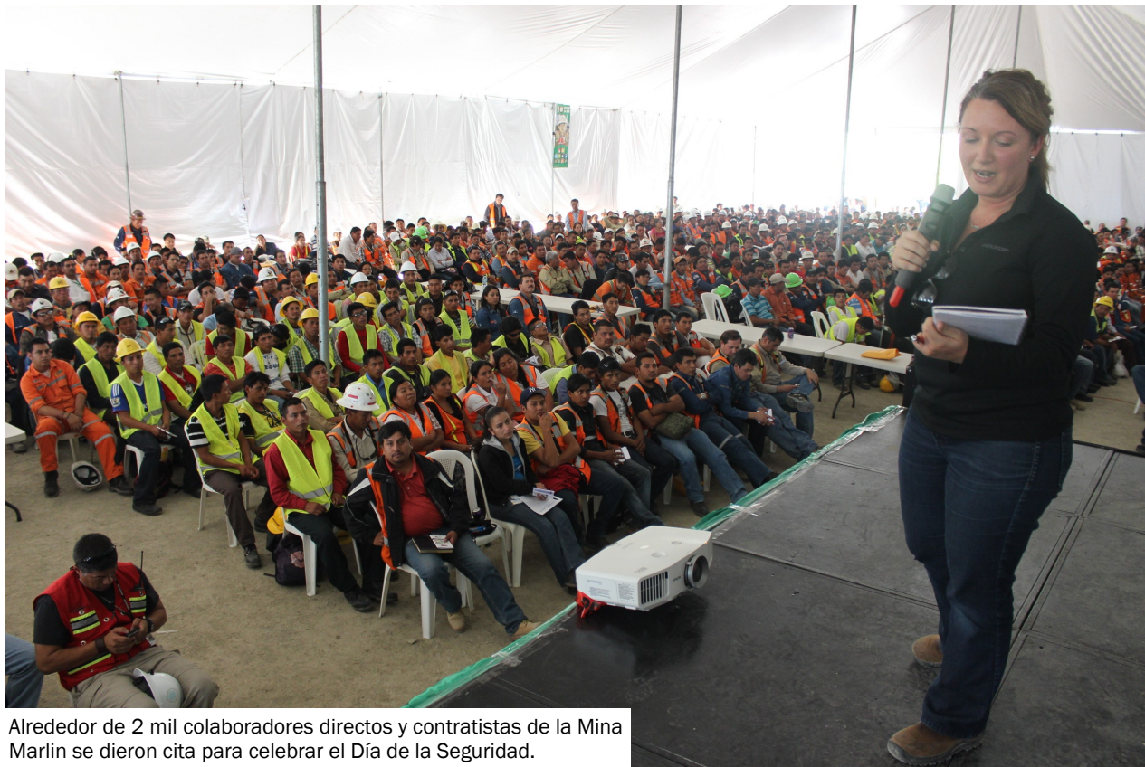
Alrededor de 2 mil colaboradores directos y contratistas de la Mina Marlin se dieron cita para celebrar el Día de la Seguridad.