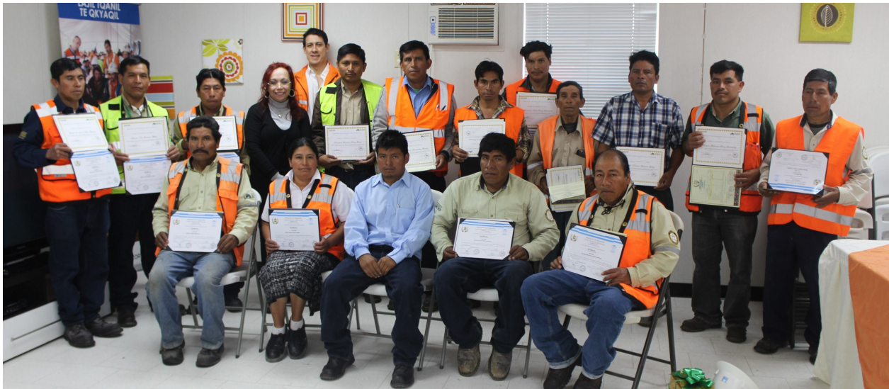
18 colaboradores de Marlin culminaron la segunda etapa de alfabetización, equivalente a completar la educación primaria.

Con el cierre del ciclo escolar de este año, 42 trabajadores de la mina vieron cumplidos sus