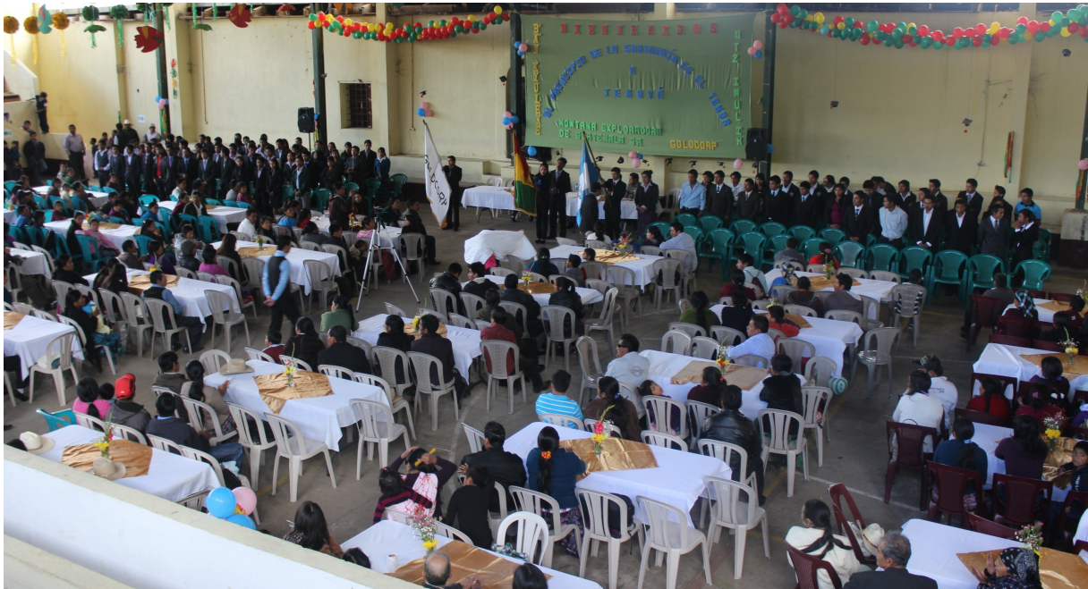
El gimnasio municipal de San Miguel Ixtahuacán en el acto de graduación de alumnos becados por la Mina Marlin.

Durante el ciclo escolar 2014, Montana Exploradora de Guatemala, apoyó a 151 estudiantes con una bolsa escolar, con la cual mantienen sus estudios de nivel diversificado; con ese estipendio principalmente cubren el pago de colegiaturas, gastos de transporte y la adquisición de útiles escolares.