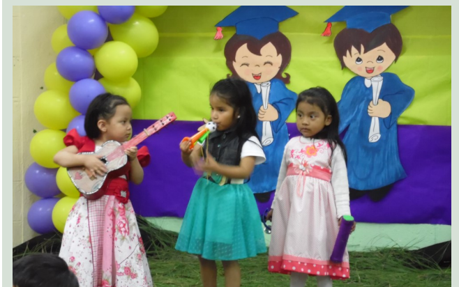
Durante el acto de graduación, las 3 pequeñas laureadas deleitaron a los presentes con actos musicales.

Por último ingresan al área de Maternal 2, que es de dos añitos a tres. En las distintas etapas los niños reciben estimulación temprana que les sirven para desarrollar sus habilidades motrices duras y finas.