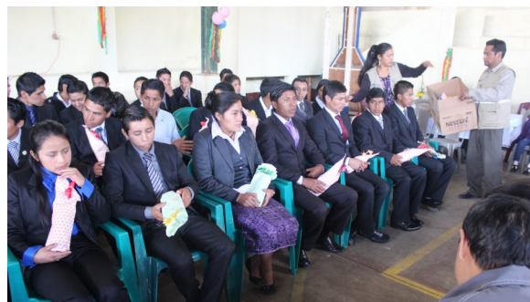
La empresa minera premió el esfuerzo a los 100 graduandos que recibieron el apoyo minero.