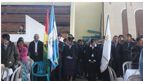
Alumnos distinguidos portaron las banderas de Guatemala, San Miguel Ixtahuacán y Goldcorp.

Durante el ciclo escolar 2014, Montana Exploradora de Guatemala, apoyó a 151 estudiantes con una bolsa escolar, con la cual mantienen sus estudios de nivel diversificado; con ese estipendio principalmente cubren el pago de colegiaturas, gastos de transporte y la adquisición de útiles escolares.