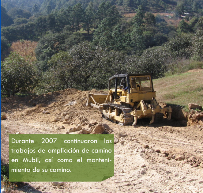
Durante 2007 continuaron los trabajos de ampliación de camino en Mubil, así como el mantenimiento de su camino.