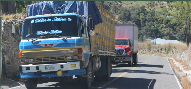
El mantenimiento constante de la ruta al 241, por medio del control de polvo y mejoramiento carretero; así como el logro del asfalto que beneficia a 7 comunidades, son ejemplos que ponen de manifiesto que la minería es desarrollo.