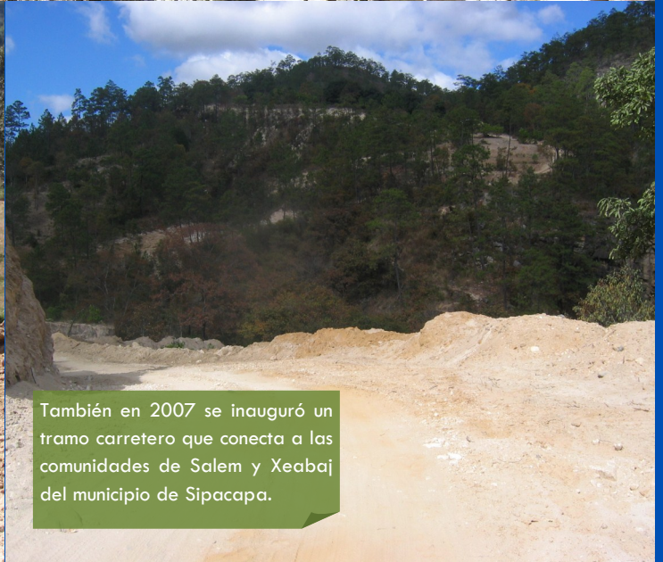
También en 2007 se inauguró un tramo carretero que conecta a las comunidades de Salem y Xeabaj del municipio de Sipacapa.