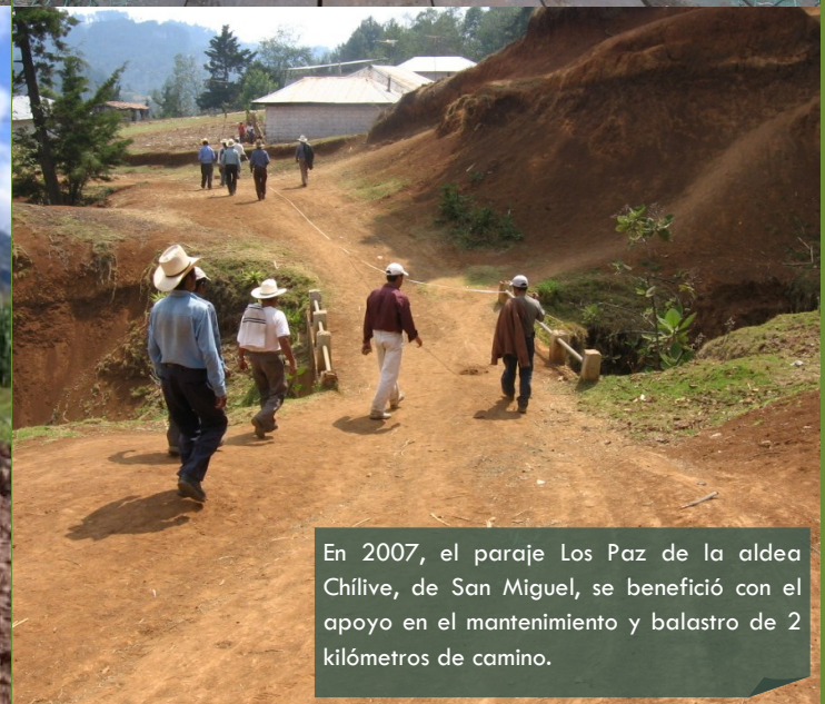
En 2007, el paraje Los Paz de la aldea Chílve, de San Miguel, se benefició con el apoyo en el mantenimiento y balastro de 2 kilómetros de camino.