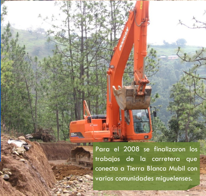
Para el 2008 se finalizaron los trabajos de la carretera que conecta a Tierra Blanca Mubil con varias comunidades miguelenses.