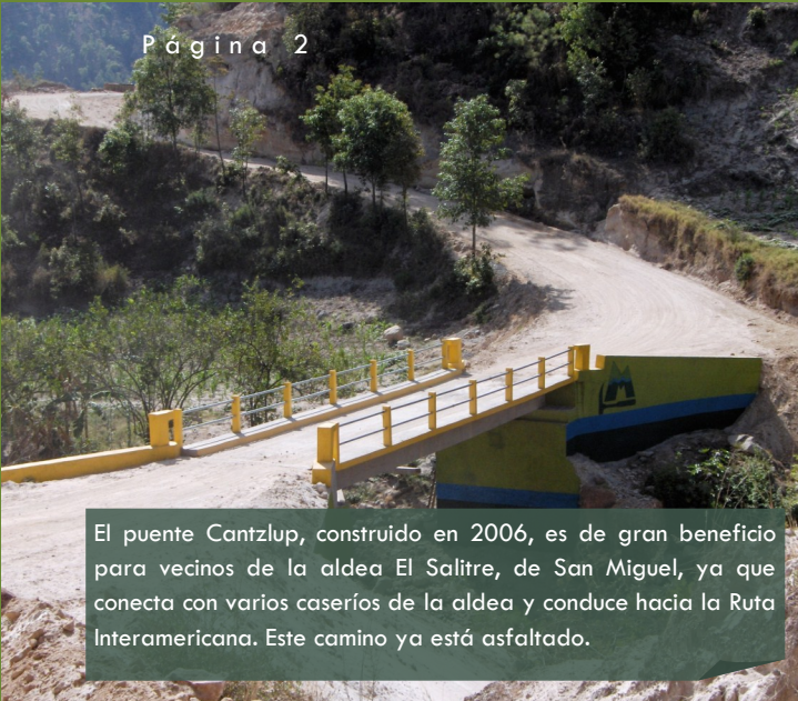
El puente Cantz lup, construido en 2006, es de gran beneficio para vecinos de la aldea El Salitre, de San Miguel, ya que conecta con varios caseríos de la aldea y conduce hacia la Ruta Interamericana. Este camino ya está asfaltado.