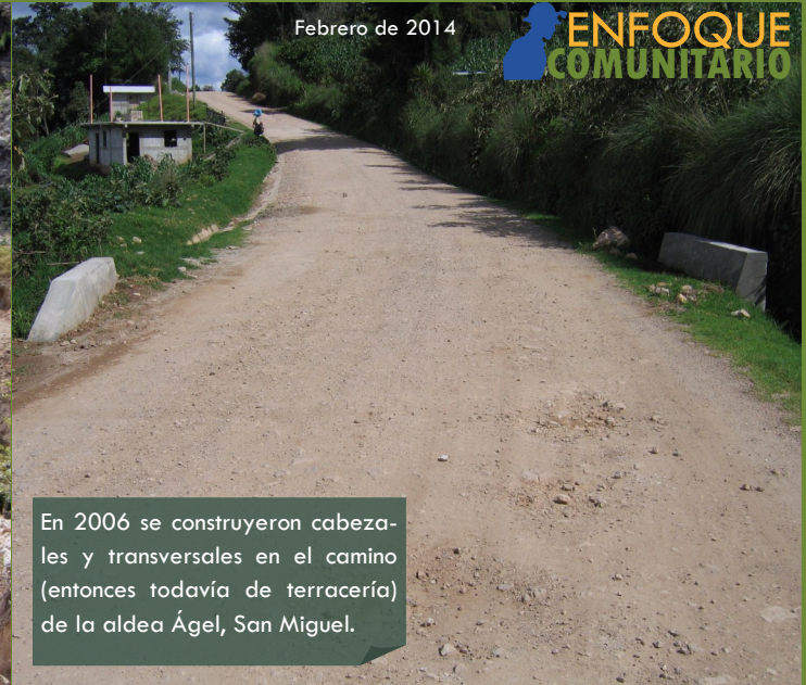
En 2006 se construyeron cabezales y transversales en el camino (entonces todavía de terracería) de la aldea Ágel, San Miguel.