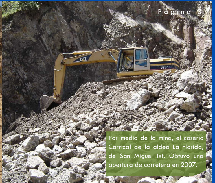
Por medio de la mina, el caserío Carrizal de la aldea La Florida, de San Miguel Ixt. Obtuvo una apertura de carretera en 2007.