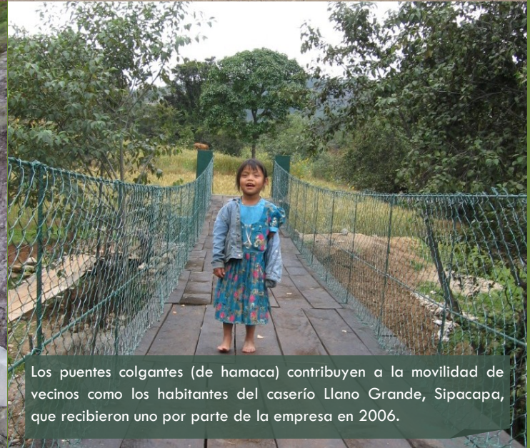
Los puentes colgantes (de hamaca) contribuyen a la movilidad de vecinos como los habitantes del caserío Llano Grande, Sipacapa, que recibieron uno por parte de la empresa en 2006.