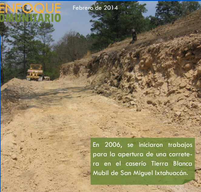
En 2006, se iniciaron trabajos para la apertura de una carretera en el caserío Tierra Blanca Mubil de San Miguel Ixtahuacán.