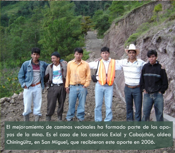
El mejoramiento de caminos vecinales ha formado parte de los apoyos de la mina. Es el caso de los caseríos Exial y Cabaichún, aldea Chingüitz, en San Miguel, que recibieron este aporte en 2006.