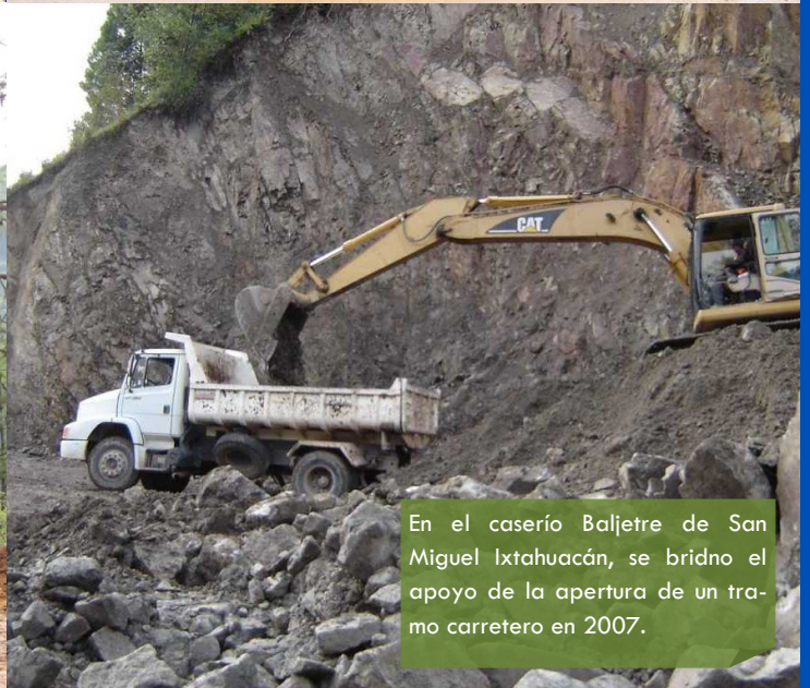
En el caserío Baljetre de San Miguel Ixtahuacán, se brindó el apoyo de la apertura de un tramo carretero en 2007.