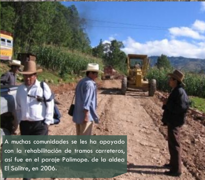
A muchas comunidades se les ha apoyado con la rehabilitación de tramos carreteros, así fue en el paraje Palimope, de la aldea El Salitre, en 2006.