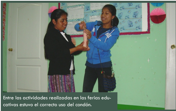
Entre las actividades realizadas en las ferias educativas estuvo el correcto uso del condón.

Domingo participó en las ferias educativas enseñando el uso adecuado de la protección, e hizo énfasis en que, muchas veces, el uso del condón puede ser un tema tabú en las comunidades ya que prefieren tener niñas embarazadas o familias numerosas, a que se hable de anticonceptivos.