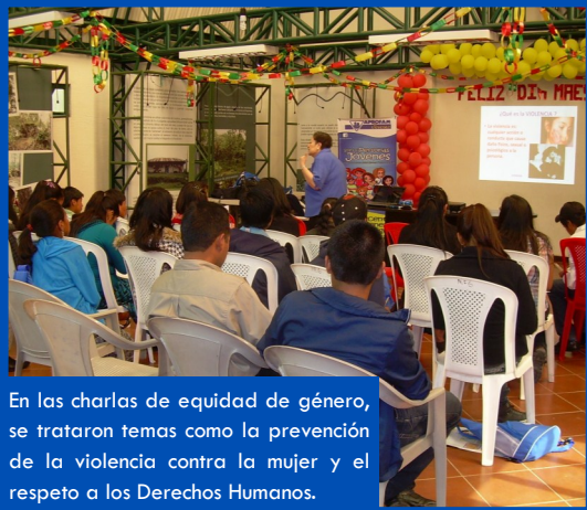
En las charlas de equidad de género, se trataron temas como la prevención de la violencia contra la mujer y el respeto a los Derechos Humanos.